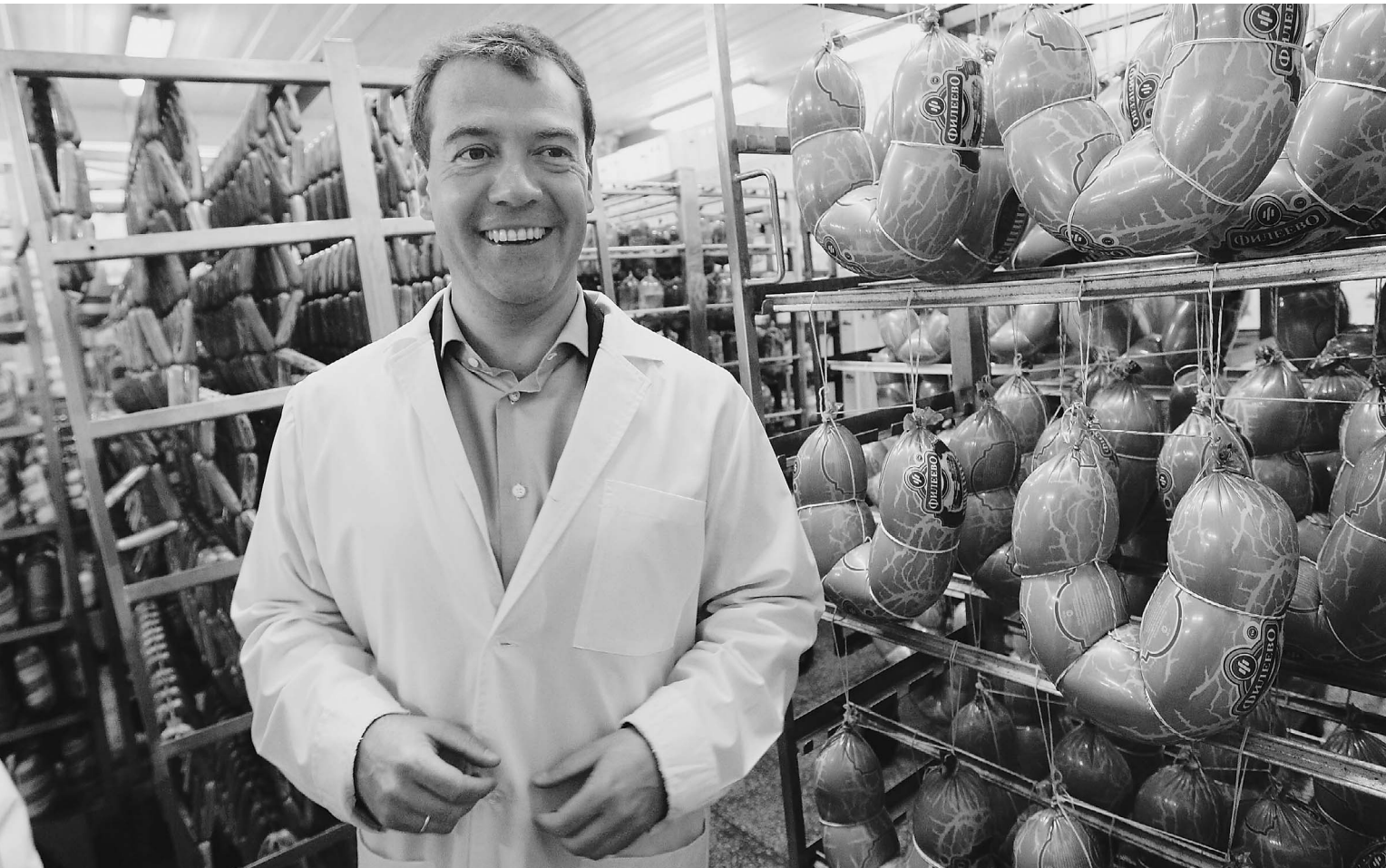
Глава государства убедился, что продуктов даже после засухи хватит всем

Дмитрий Медведев нацелил губернаторов на борьбу со спекулянтами