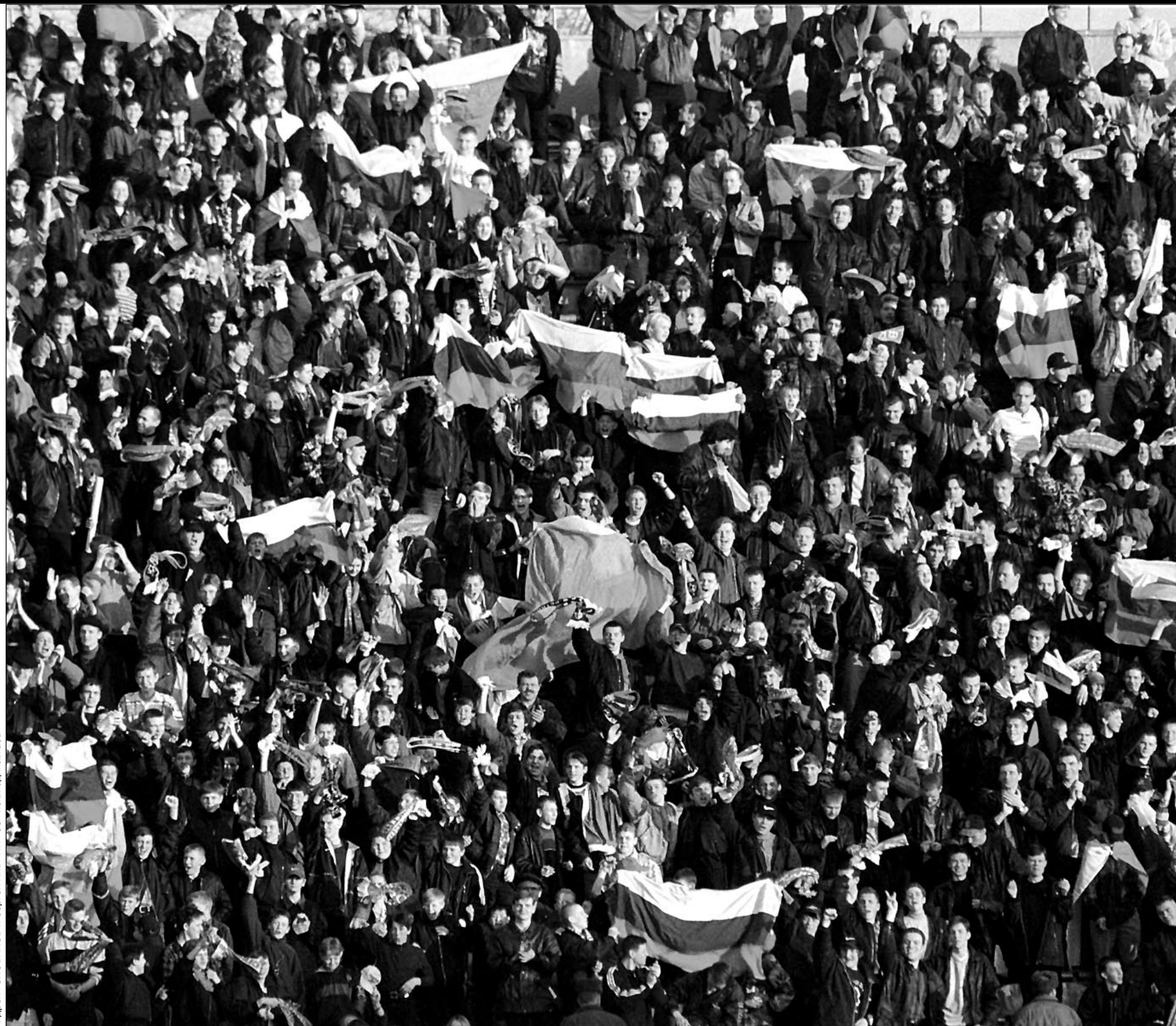
Трибуны владикавказского стадиона «Спартак», как и почти всех остальных арен, на матче первого тура были заполнены до отказа.