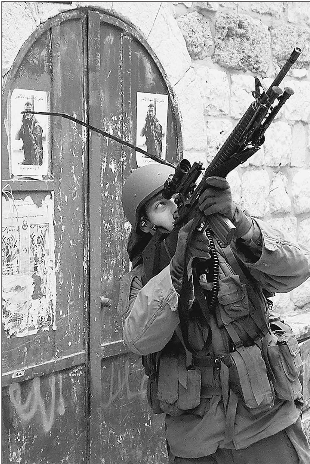
Война пришла на паперть

Церковь Рождества Христова в Вифлееме осаждена