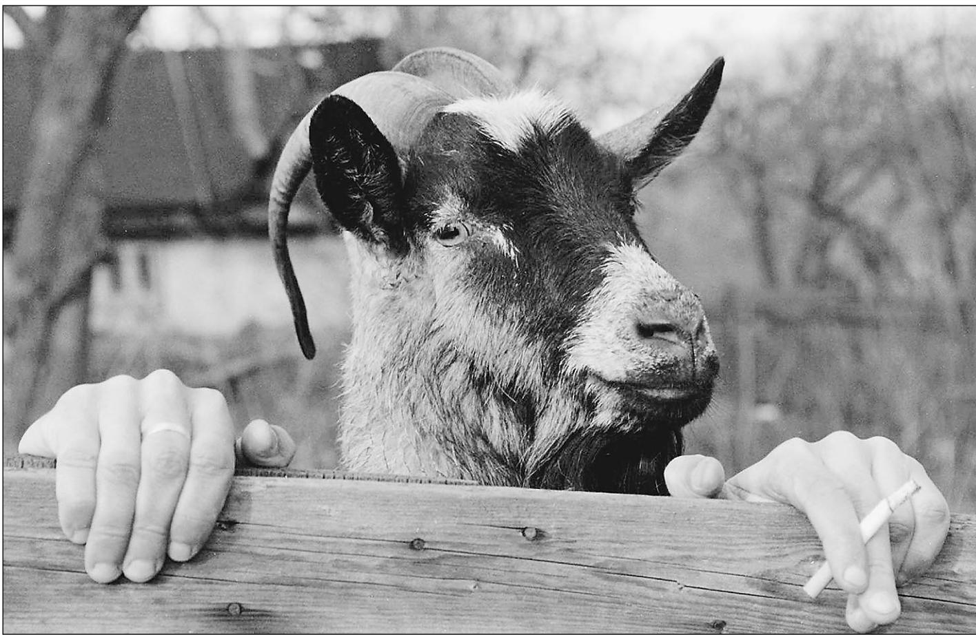
Мы не козлы, козлы — не мы

Вот российского обывателя, к примеру, совсем не волнует про- блема генетически модифициро- ванной пищи, которая попадает к нему из-за рубежа. Нет паники по поводу «мобильников» — ни сре- ди «новых русских», ни среди прочих категорий, которым они становятся все более доступны.