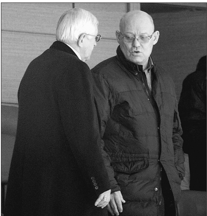
Вчера. Москва. ЦСКА - «Динамо» М - 0:2. Легенды армейского хоккейного клуба Владимир ПЕТРОВ (справа) и Борис МИХАЙЛОВ.

Вчера россияне одержали сразу несколько красивых побед в зимних видах спорта