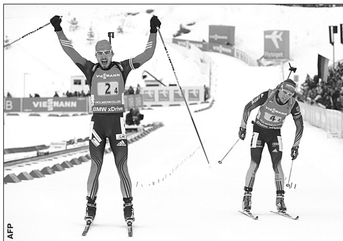
Вчера. Холменколлен. Антон ШИПУЛИН после победного финиша.

Наши биатлонисты в Холменколлене выиграли уже третью эстафетную гонку на этапах Кубка мира-2014/15.