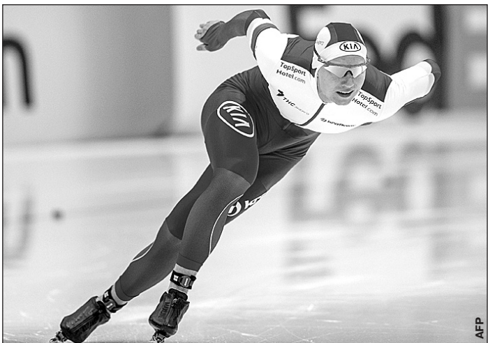
Вчера. Херенвен. Павел КУЛИЖНИКОВ во время забега на 500 м.

Конькобежец Павел Кулижников в Херенвене стал первым европейцем, выигравшим 500-метровую дистанцию на чемпионате мира.