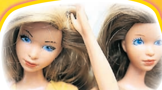
Самые знаменитые ИГРУШКИ