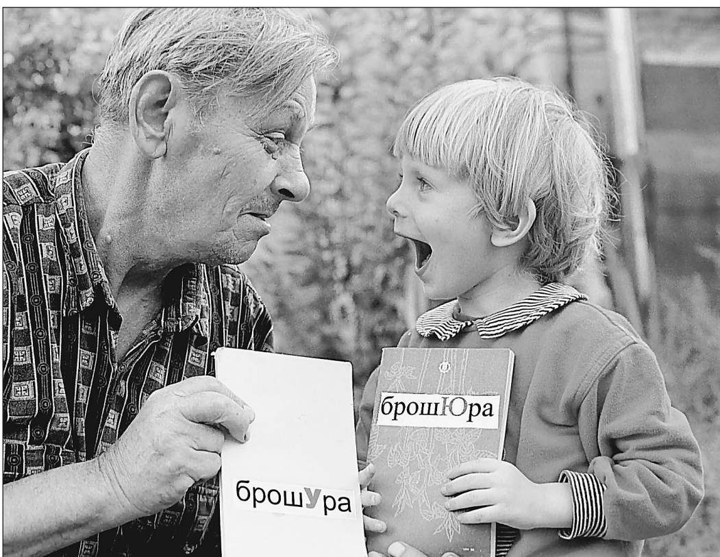
Правильно ли мы говорим...

Любимый способ борьбы за чистоту — обращение к народу. Посылают народу, народ посылает в ответ. А народ благородный посыл обращается неслепотой или глупостью. Видимо, такая судьба у нашего многострадального Отечества: вечно бороться за слова, подменяя ими — Дело.