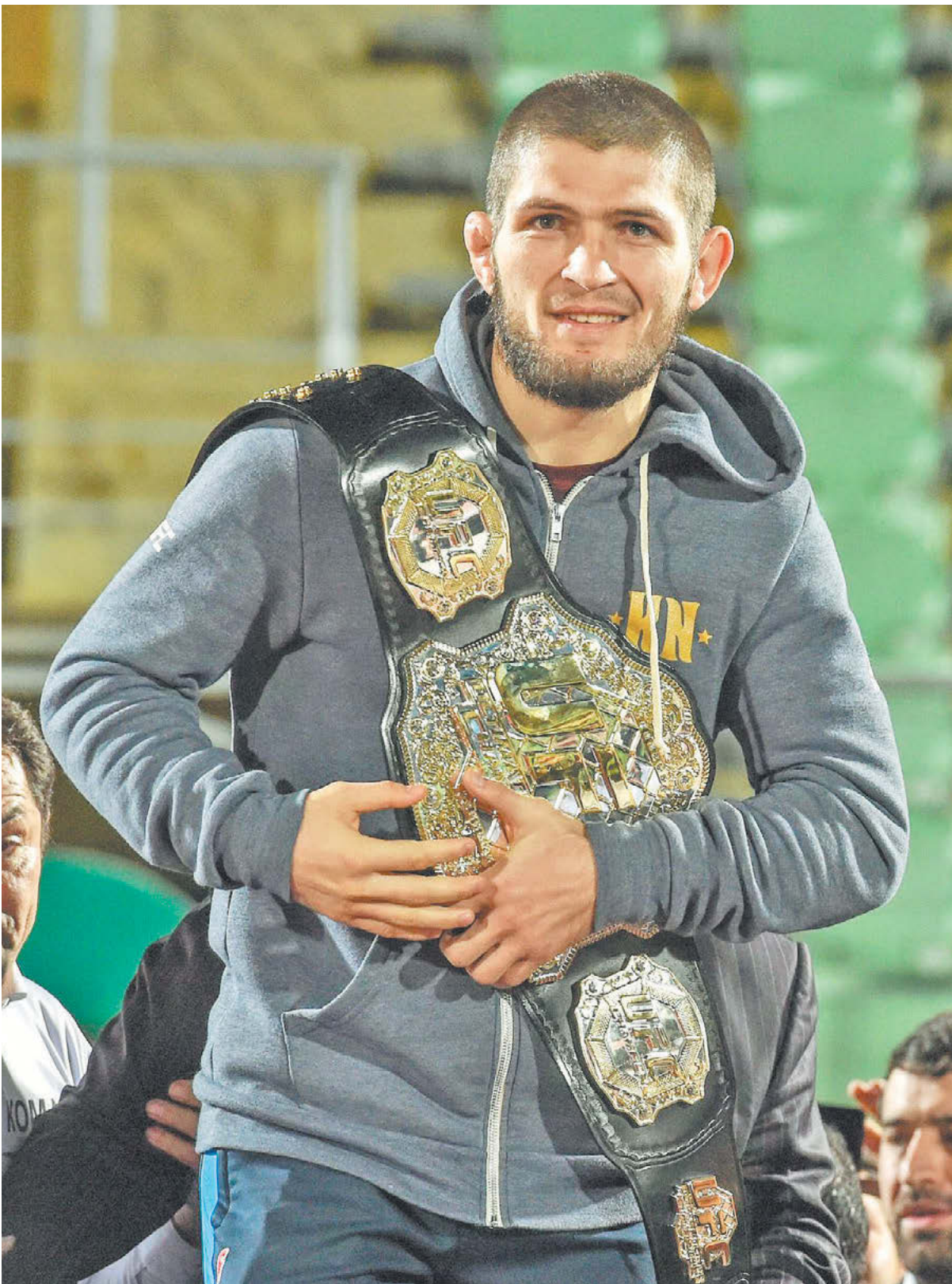
8 октября 2018 года. Махачкала. Два дня назад Хабиб Нурмагомедов одержал победу над Конором Макгрегором, защитив титул чемпиона UFC в легком весе