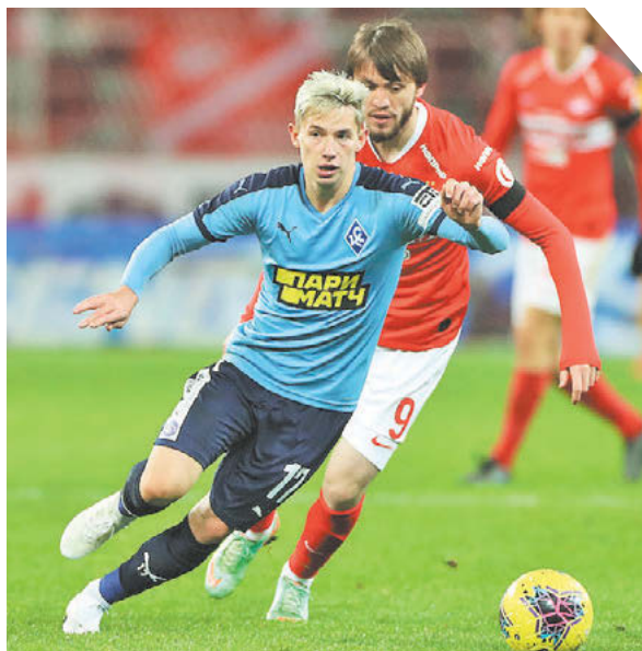
Александр Федоров «СЗ» / Canon EOS-1D X Mark II