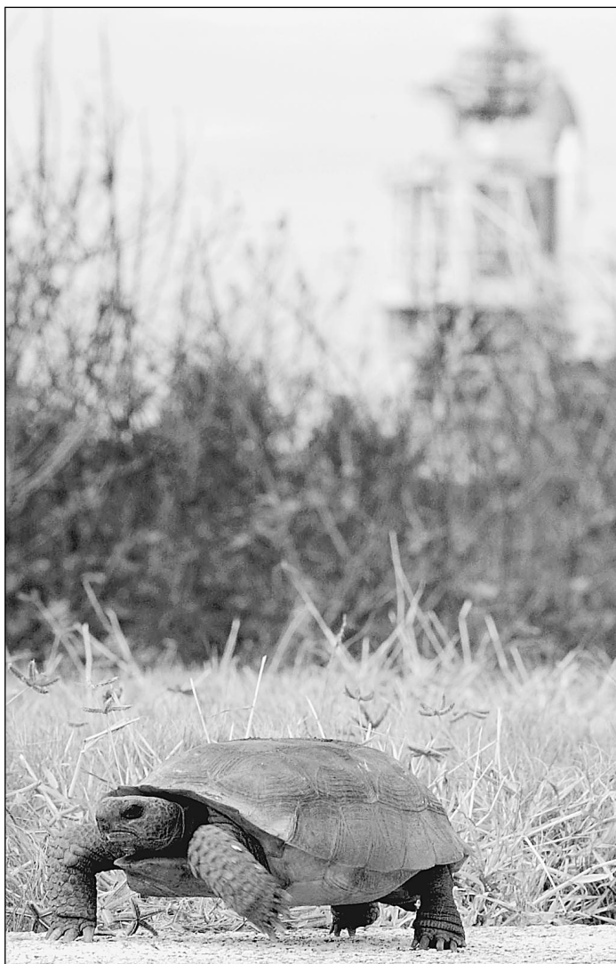
Первая космическая скорость (на заднем плане «Шаттл»)

В 1975-м в полете «Союз—Аполлон» мы были равны. Экипажи даже выгорали друг друга. Это до сих пор не афишируется, но командиры Алексей Леонов и Томас Стаффорд принимали совместные решения, о которых не ставили в известность коммунистических и капиталистических начальников на Земле. Уважение и доверие — это производные равенства. Времена «Союза—Аполлона» ушли в прошлое... Видимо, и в будущем на МКС между астронавтами и космонавтами будут конфликты. В том числе психологические. Ведь даже отношение в экипажах строится по-разному. У американцев — культ командира, его указания выполняются беспрекословно, дисциплина доходит до смешных, по нашим меркам, мелочей — приема витаминов и лишнего глотка