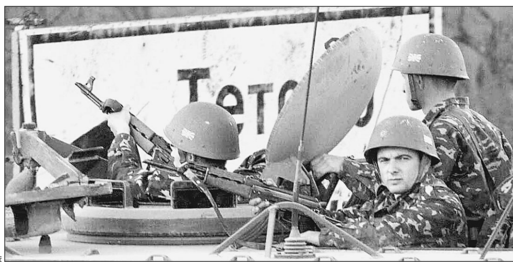
В Тетово пришла настоящая война

А на Балканах все иначе. В Косово обстановка до сих пор критическая — то убивают последних оставшихся сербов, то обстреливают миротворцев, то атакуют полицейские посты ООН. «Этнические чистки», которые Запад не позволил осуществить Милошевичу, успешно провели боевики АОК. В бывшем автономном крае неалбанского населения сегодня почти не осталось. Но если бы только Косово... Ожесточенные бои шли на юге Сербии, в Прешевской до-