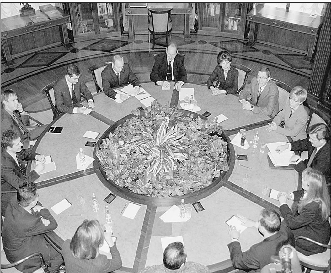
«Кто? Где? Когда?»: сектор «зеро»

Элберт Грин ХАББАРД, американский писатель.