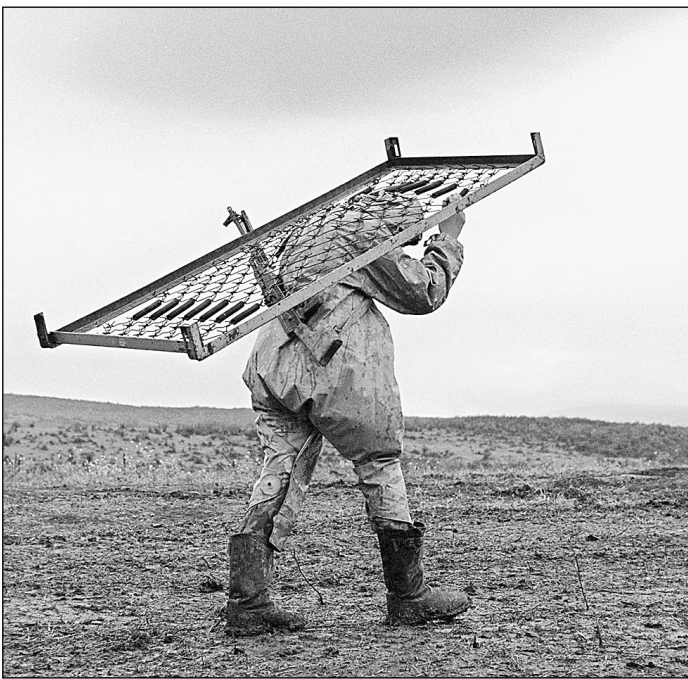
Куда бежать, если бежать некуда?