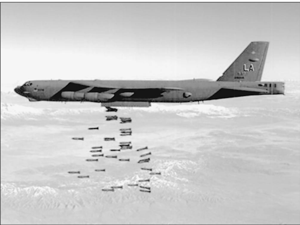
7 октября. Б-52 бомбит Афганистан