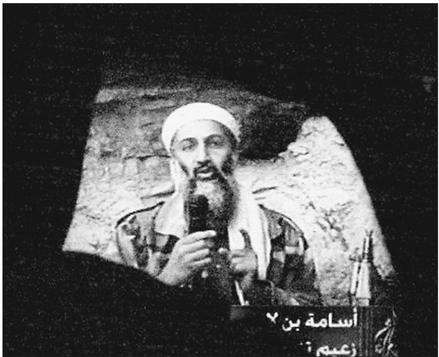
7 октября. Осама бен Ладен обращается к миру