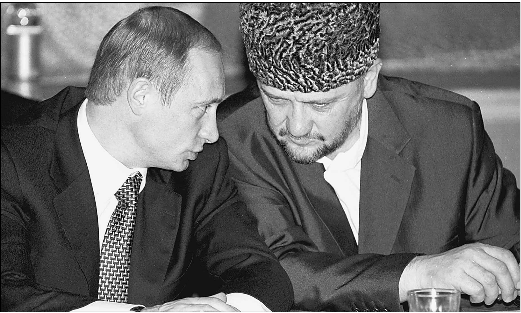
Владимир Путин и Ахмад Кадыров разберутся, кто финансирует бен Ладена

Вчера президент России подписал указ «О мерах выполнения резолюций Совета Безопасности ООН». Имеется в виду противодействие финансированию организаций «Аль-Каида», движения «Талибан» и связанных с ними структур. Формально указ связан с финансированием международных исламских террористов. Формально Путин подписывал такие документы во исполнение резолюций Совета Безопасности ООН уже дважды — 5 мая 2000 года и 6 мая 2001 года. Опять же формально единственное скальпо-нибудь существенное изменение в этом указе по сравнению с прежними — разрешение на полеты над российской территорией авиаконвоя «Ариана», которую теперь уже не контролируют талибы. Однако можно с уверенностью говорить: очера дан старт новому этапу контртеррористической операции в Чечне. Во-первых, указ, в отличие от предыдущих, подписан ПОСЛЕ известных событий в США 11 сентября 2001 года. Во-вторых, некоторые формулировки этого документа дают политическую возможность немедленно начать полномасштабную экономическую войну с чеченскими боевиками. Под предлогом борьбы с финансированием международных террористов Москва попытается наконец полностью лишить ресурсов своих, «доморожденных» чеченских боевиков.