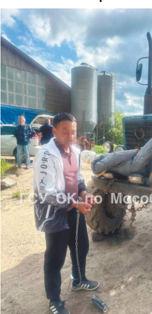
захотел помогать ему и куда-то ушел. Поиски подростка велись несколько дней. Искли везде, в том числе в лесу. Все это время отец и мама пропадавшего надеялись увидеть сына живым. Тело нашел 31 мая местный житель. Тракториста сразу же задержали.

Тракторист сбросил тело в ближайшую реку. При этом всем знакомым и родственникам помощника убийцы поневоле сказал, что мальчик не