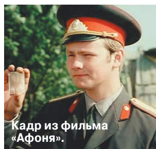
Кадр из фильма «Афоня»

Как стало известно «МК», инцидент произошел в пятницу: 69-летний артист пристегнул свой самокат к ограде станции в 7 утра, а вечером, вернувшись за своим средством индивидуальной мобильности, уже не обнаружил его на месте. Правоохранителям актер пояснил, что его СИМ стоило 15 тысяч рублей. Двое суток понадобилось оперативникам, чтобы выйти на след нарушителя. Им удалось идентифицировать злодея благодаря записям с камер видеонаблюдения. Когда похититель будет задержан, уже станет понятно, успел он избавиться от электросамоката или оставил для собственных нужд.