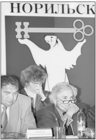
Джеймсу Вулфенсону все же удалось дать нам деньги