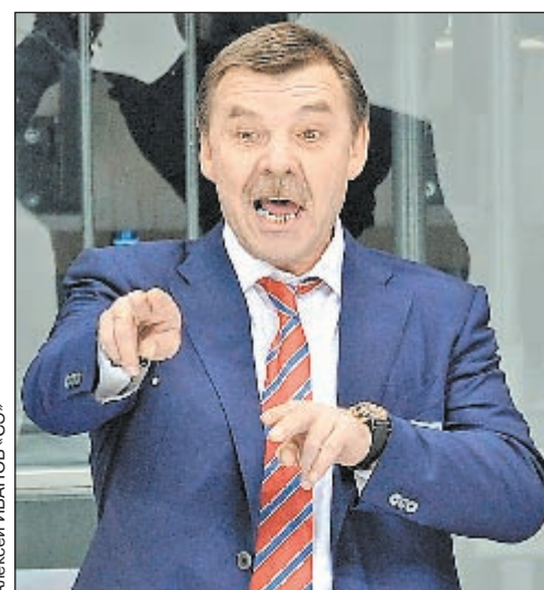
Главный тренер СКА Олег ЗНАРОК знает свой бывший клуб - московское «Динамо», как никто другой.

Поздравляем всех женщин с праздником весны - 8 Марта! Следующий номер «СЭ» выйдет в четверг, 9 марта, на 12 страницах