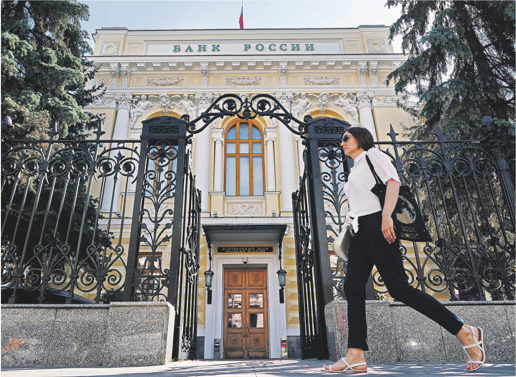
Павел Бочкарев / Известия