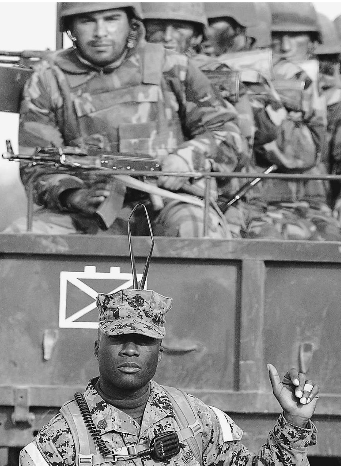
АМЕРИКАНСКИЙ УЧИТЕЛЬ и его грузинские ученики

Грузия предоставила для этого свою территорию и решила, что после этого ей все дозволено?