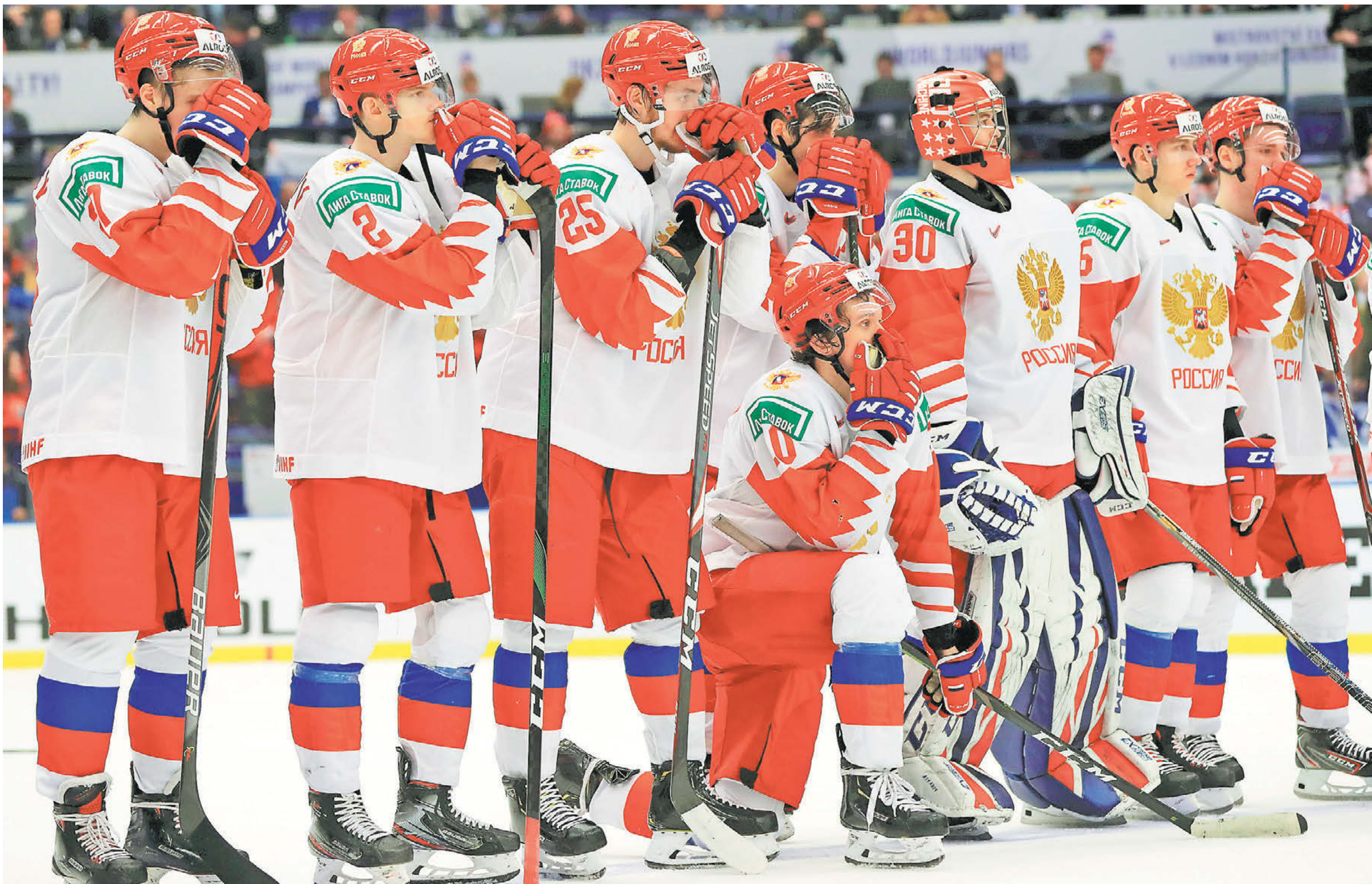
5 января. Острава. Канада U-20 – Россия U-20 – 4:3. Сборная России – серебряный призер молодежного чемпионата мира-2020

Главное спортивное событие новогодних дней – молодежный чемпионат мира, в финале которого встретились Россия и Канада. Наша сборная вела 3:1, но уступила 3:4