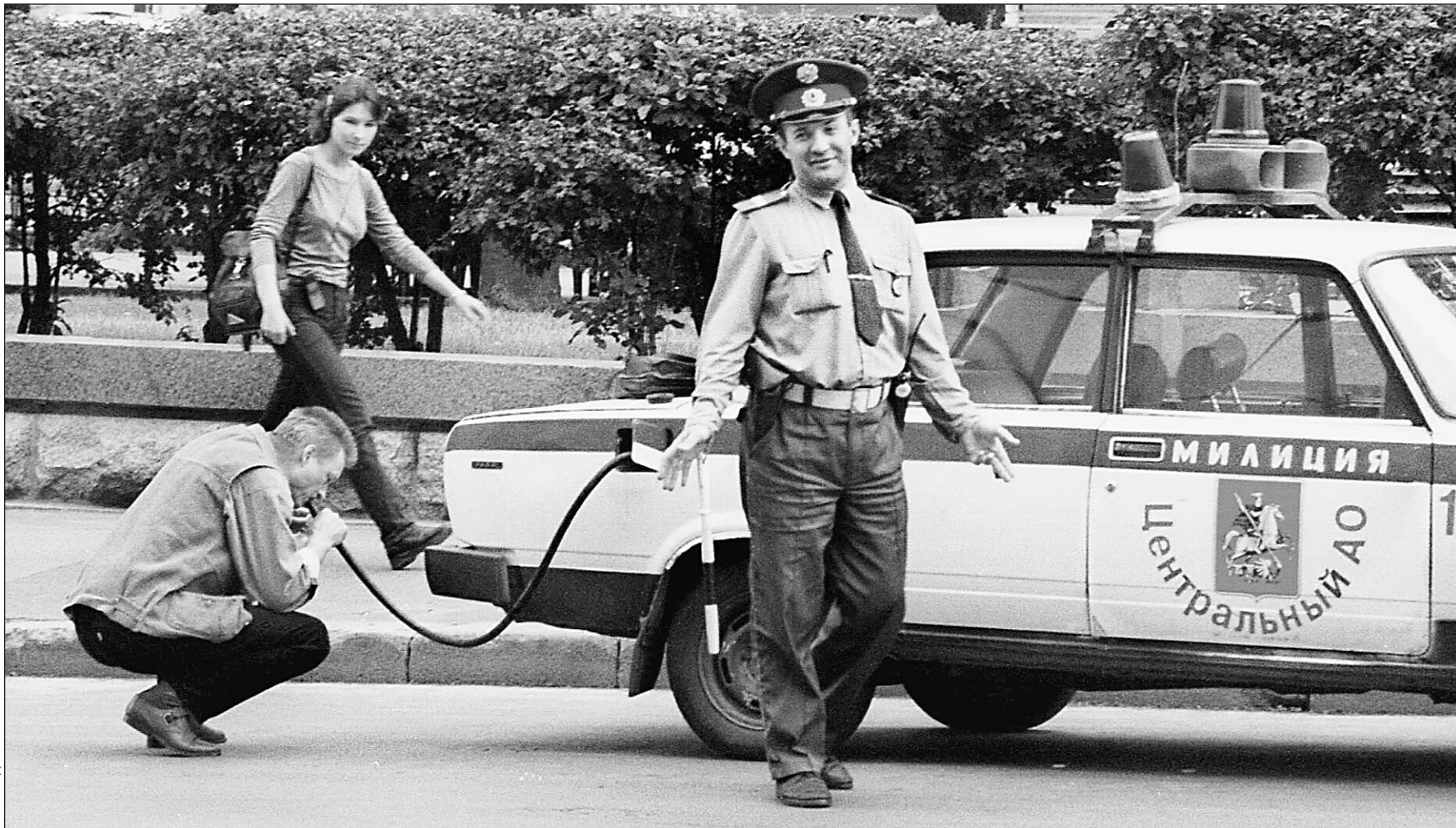
Перед штрафом не надышишься

Госавтоинспекция не может сдать экзамен на демократию