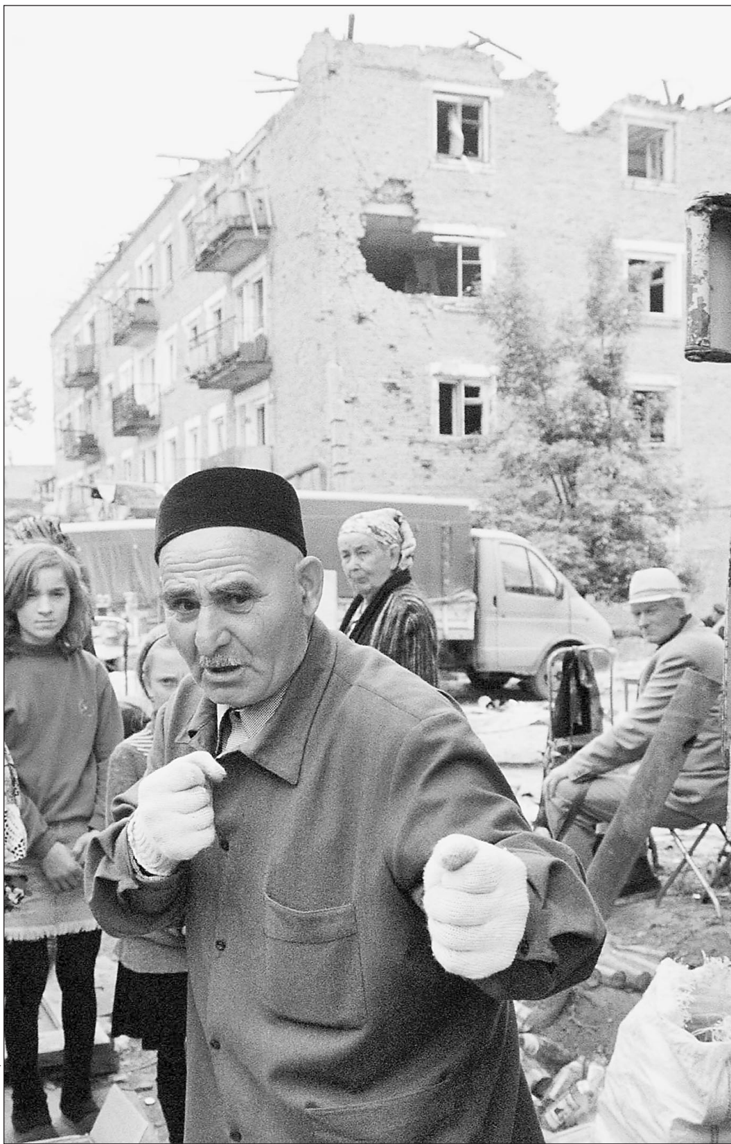
Война гражданских и военных властей Чечни провоцирует агрессивность у местного населения