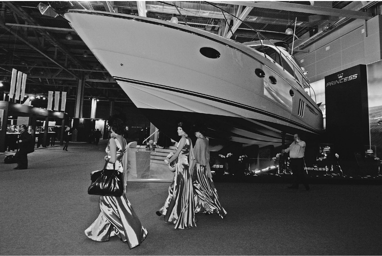
Прикупить шикарную яхту — золотая мечта каждого российского толстосума

Годовой доход среднего жителя России за десятилетие увеличился почти в пять раз — с 1708 долларов до 10 408 долларов, говорится в докладе банка Credit Suisse. По всему миру люди стремительно богатеют, но наша страна оказалась впереди всех. Несмотря на это, Россия по-прежнему находится в группе бедных государств. Есть ли перспективы выбиться из этой группы, «Известия» спросили у экспертов.