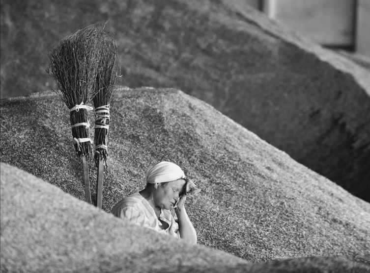
Горе от зерна: большой урожай — плохо, маленький — еще хуже

Вчера Русская православная церковь презентовала в Зале церковных соборов храма Христа Спасителя собственный канал на YouTube. По мнению Патриарха Кирилла, интернет сможет приблизить к церкви молодежь. Ранее этим же путем пошел Ватикан, у которого тоже есть свой канал на крупнейшем видеохостинге. Презентацию канала приурочили к фестивалю право-