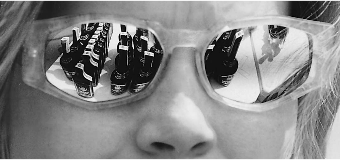
Во время новогодних праздников соотечественники не ограничивают себя в алкоголе

ОФИЦИАЛЬНЫЕ (ЦЕНТРАЛЬНЫЙ БАНК РФ) КУРСЫ ВАЛЮТ К РУБЛЮ НА 28 ДЕКАБРЯ