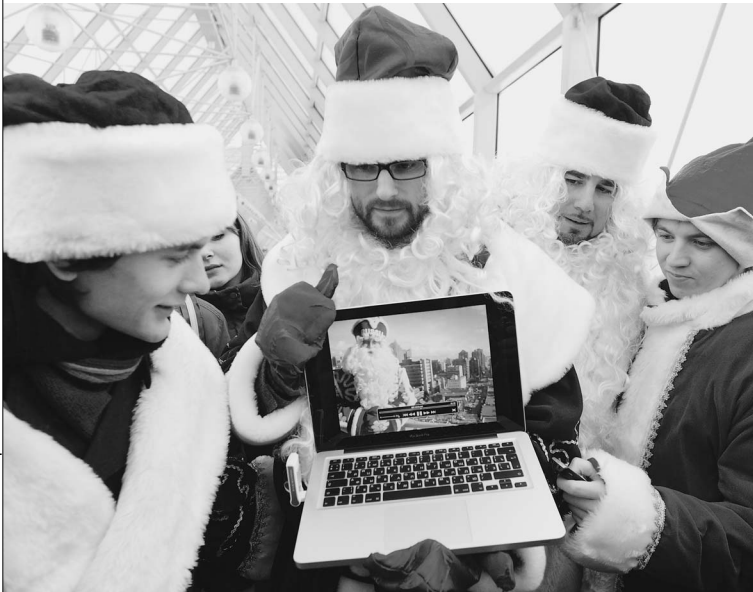
Социальными сетями уже пользуются не только политики, но и Деды Морозы