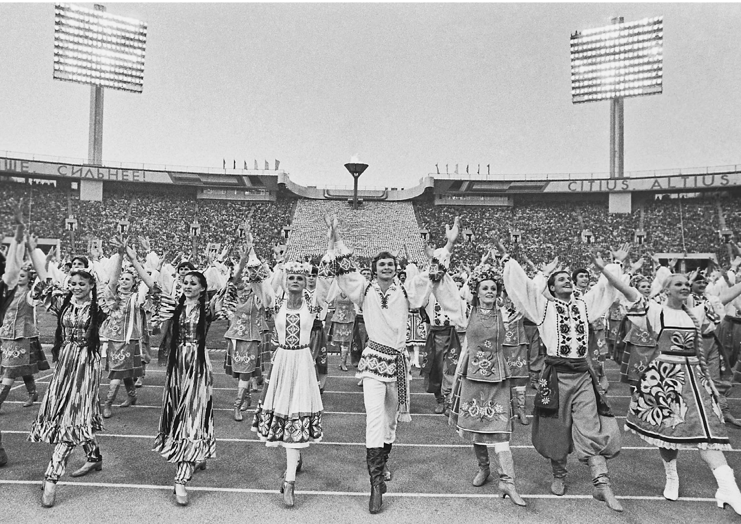
1980 год. Торжественное открытие Олимпиады в Москве.

Дмитрий Медведев предложил меры по решению национальных проблем