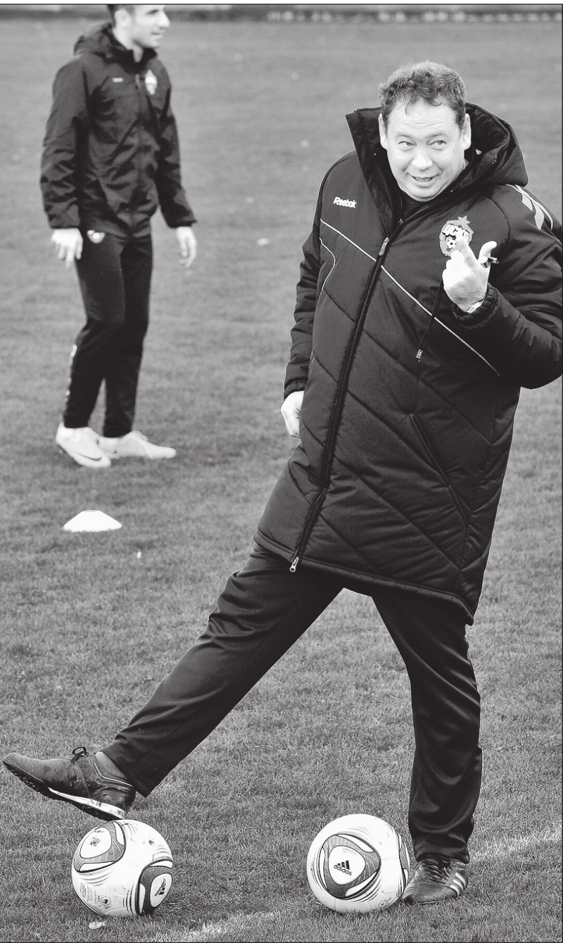
Четверг. Ватутинки. Тренировка ЦСКА. Леонид СЛУЦКИЙ.