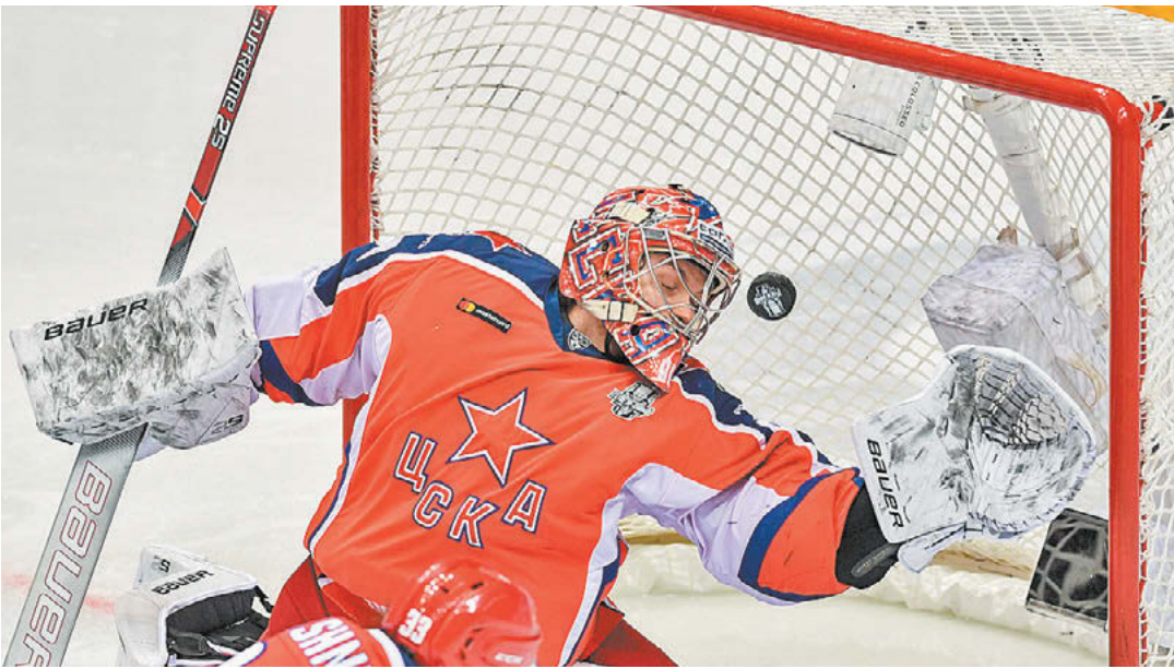
Голкипер Илья Сорокин сможет дебютировать в НХЛ в сезоне-2020/21