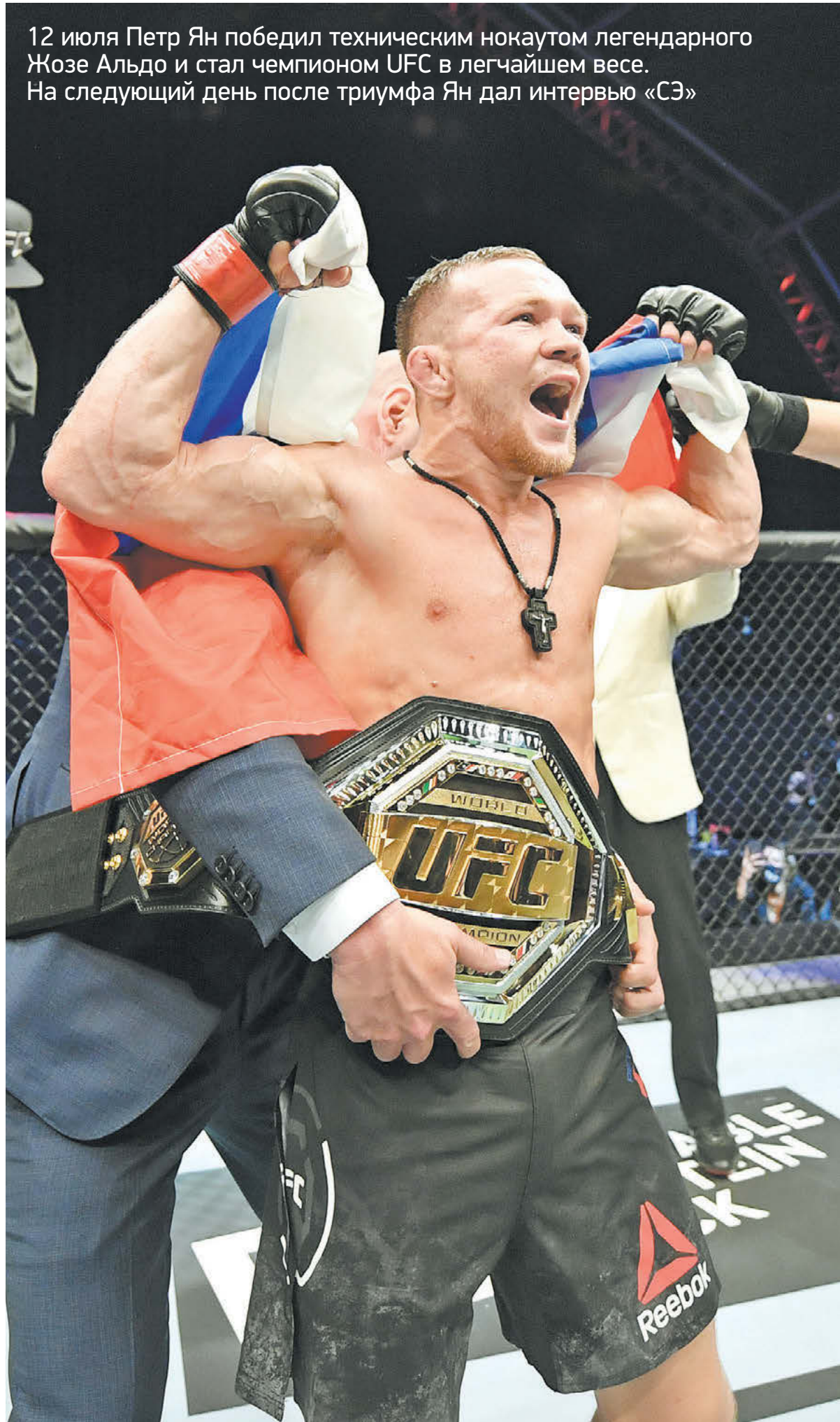
Воскресенье. Абу-Даби. Петр Ян с чемпионским поясом UFC