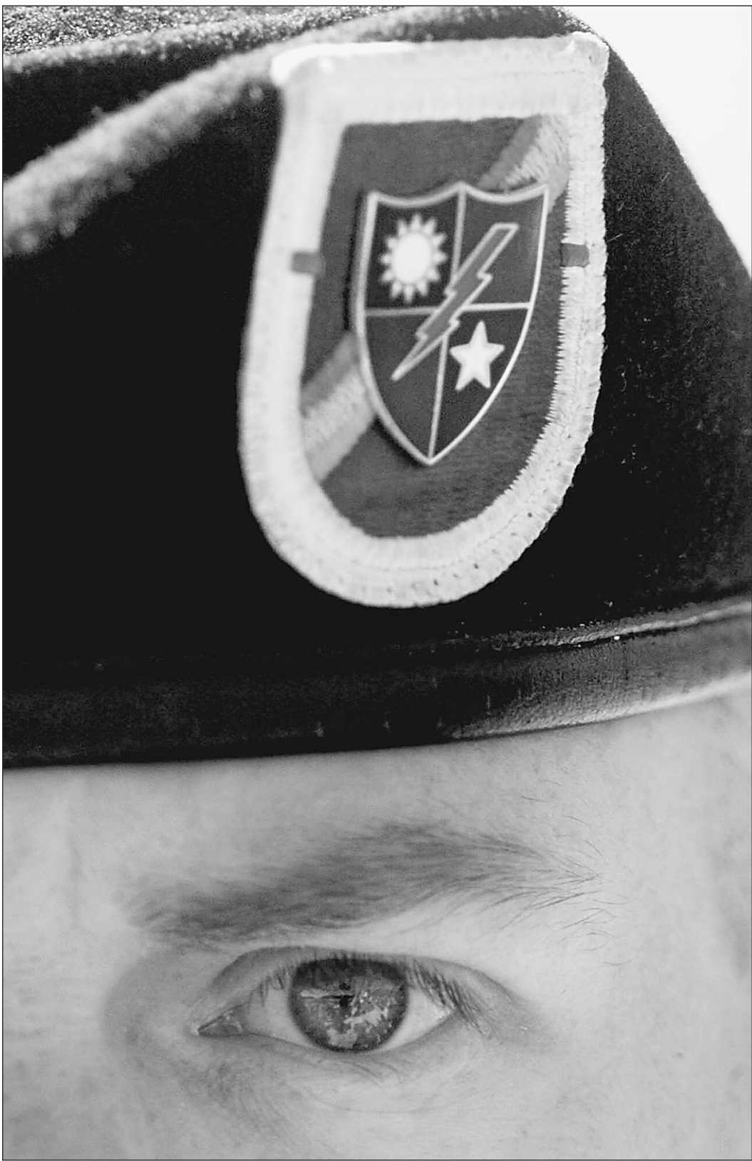
Око за око