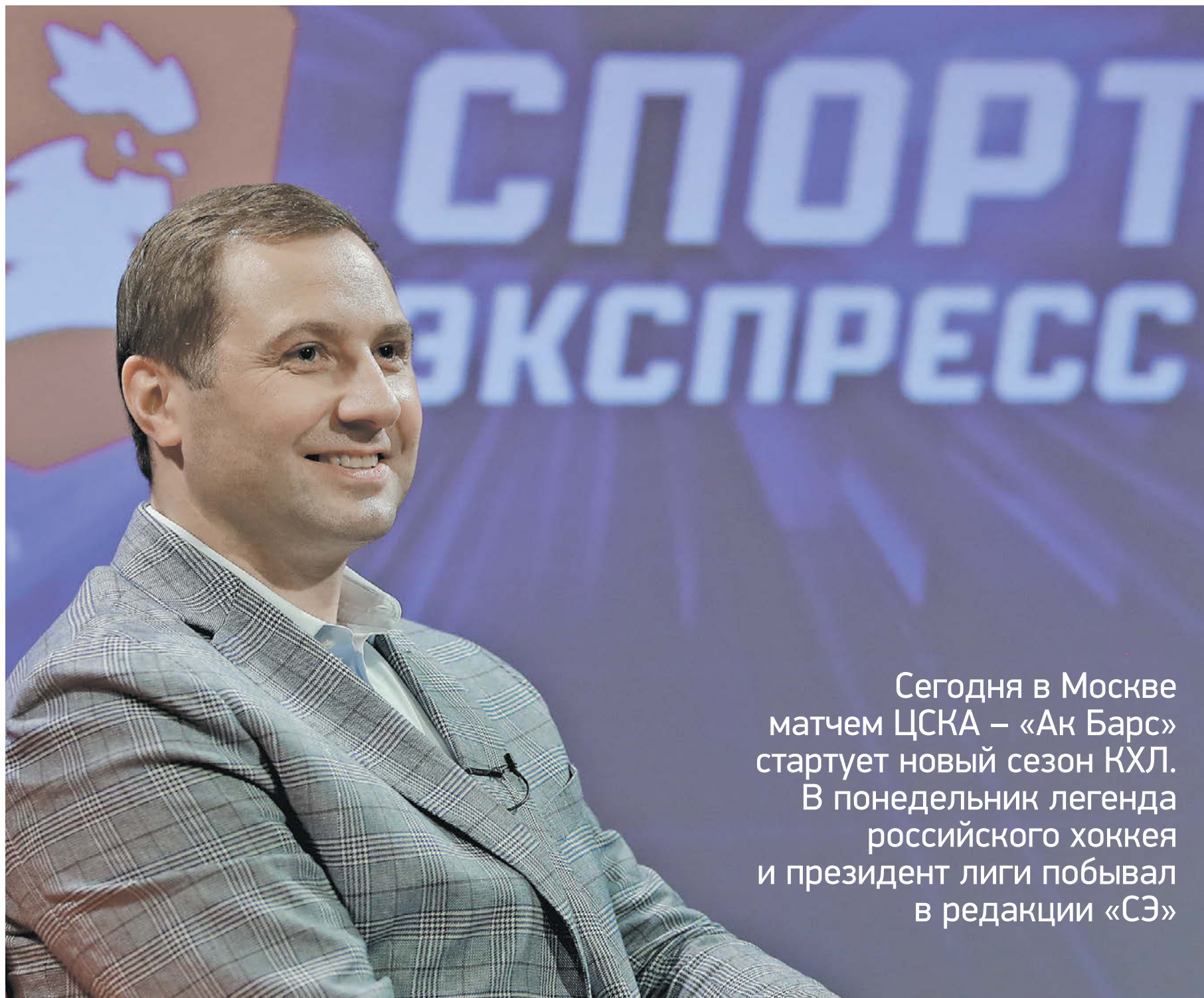
Понедельник. Москва. Президент КХЛ Алексей Морозов в редакции «СЭ»

Сегодня в Москве матчем ЦСКА – «Ак Барс» стартует новый сезон КХЛ. В понедельник легенда русского хоккея и президент лиги побывал в редакции «СЭ»