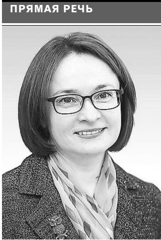
Эльвира Набиуллина, глава ЦБ: