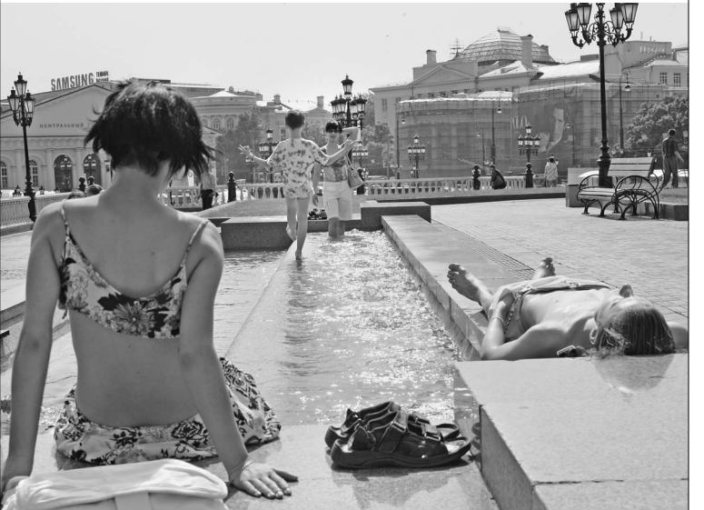
Манежная площадь превратилась в пляж