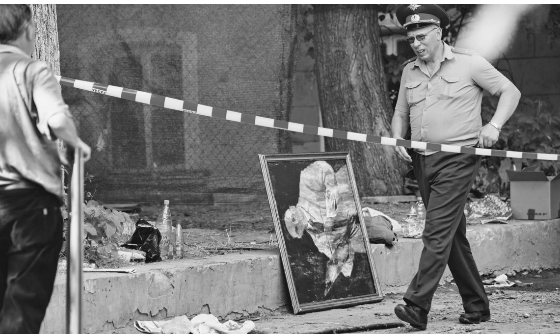
После пожара уцелевшие в огне картины взяли под охрану

Весь уикенд реставраторы оценивали потери, которые нанес пожар во Всероссийском научно-реставрационном центре имени Грабаря. В четверг, когда загорелось здание центра на улице Радио, там находилось около 1,5 тысячи произведений искусства. 400 из них принадлежали непосредственно центру, остальные были переданы на реставрацию или оценку из собраний различных музеев России и частных коллекций. Точный список утрат появится через месяц — пока эксперты осторожно говорят, что потери в денежном эквиваленте могут исчисляться миллионами рублей. Одна из невосполнимых потерь — находящаяся на реставрации картина Джорджа Доу «Александр I на коне» из Оружейной палаты Кремлевских музеев.