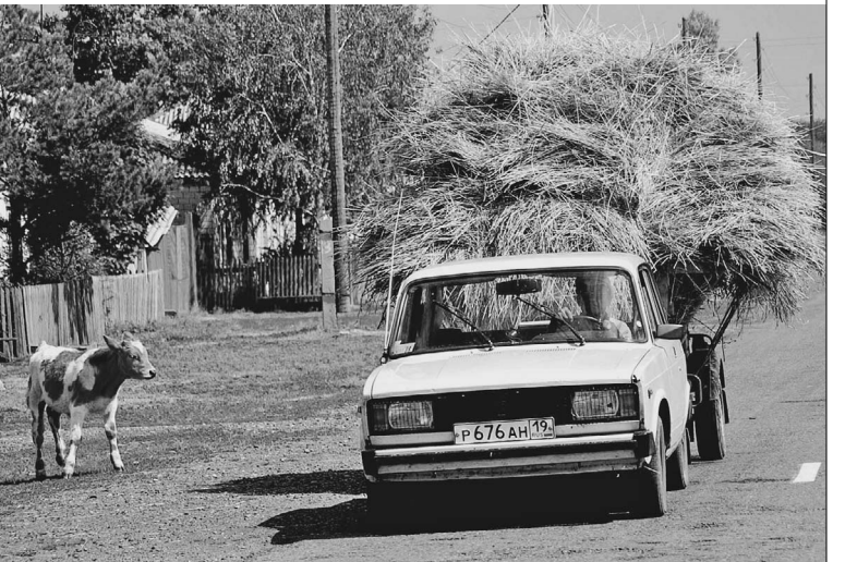
Вазовская «классика» переживает второе рождение

Всего с российских конвейеров за первые шесть месяцев сошло около полумиллиона легковых машин. Это на 68% больше,