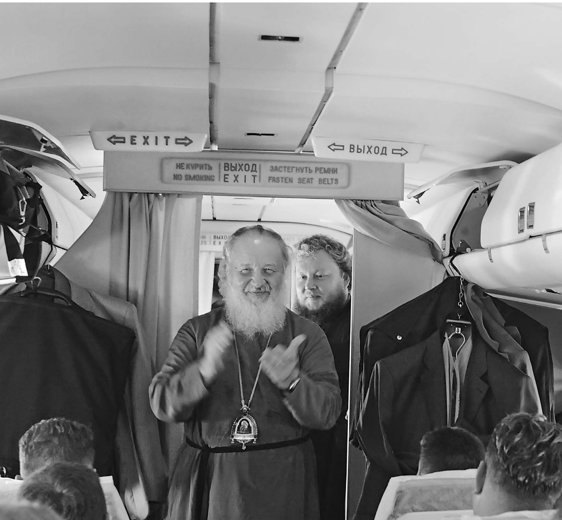
Эта фотография была сделана прошлым летом на борту самолета, когда Патриарх Кирилл возвращался в Москву после завершения первого пастырского визита на Украину

Патриарх Кирилл рассказал о своих взглядах на семью, быт, технику и взаимоотношения с другими конфессиями