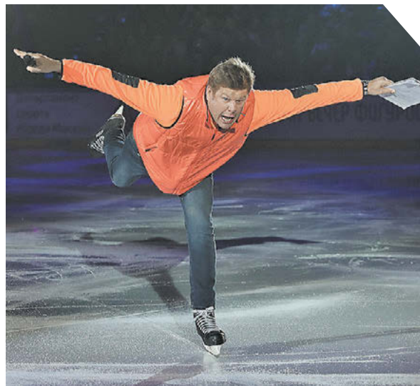
Александр Федоров «СЭ» / Canon EOS-1DX Mark II