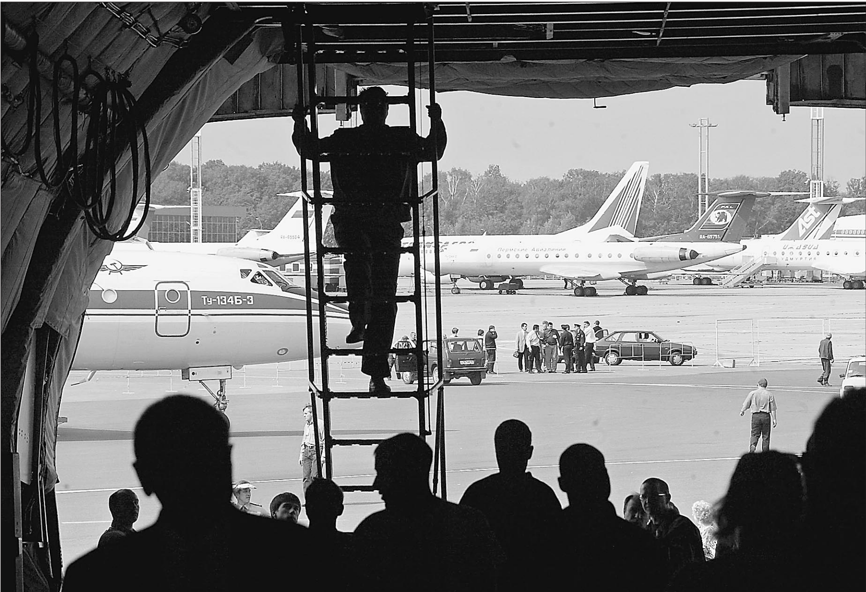
15 августа. Авиашоу в Домодедово. Предполетная подготовка