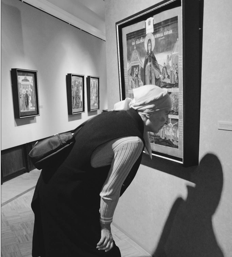
Музейщики и священнослужители спорят о том, кто должен присматривать за реликвиями — реставраторы или верующие

Премьер Владимир Путин вновь приехал в деревню Верхняя Верея Нижегородской области. Но если в первый раз он оказался на пепелище, то теперь его взгляду предстала другая картина. Когда утром 30 июля Путин, чиновники и журналисты спешно прибыли на пепелище, которое еще несколько часов назад было большой нижегородской деревней Верхняя Верея, даже самые циничные испытали шок.