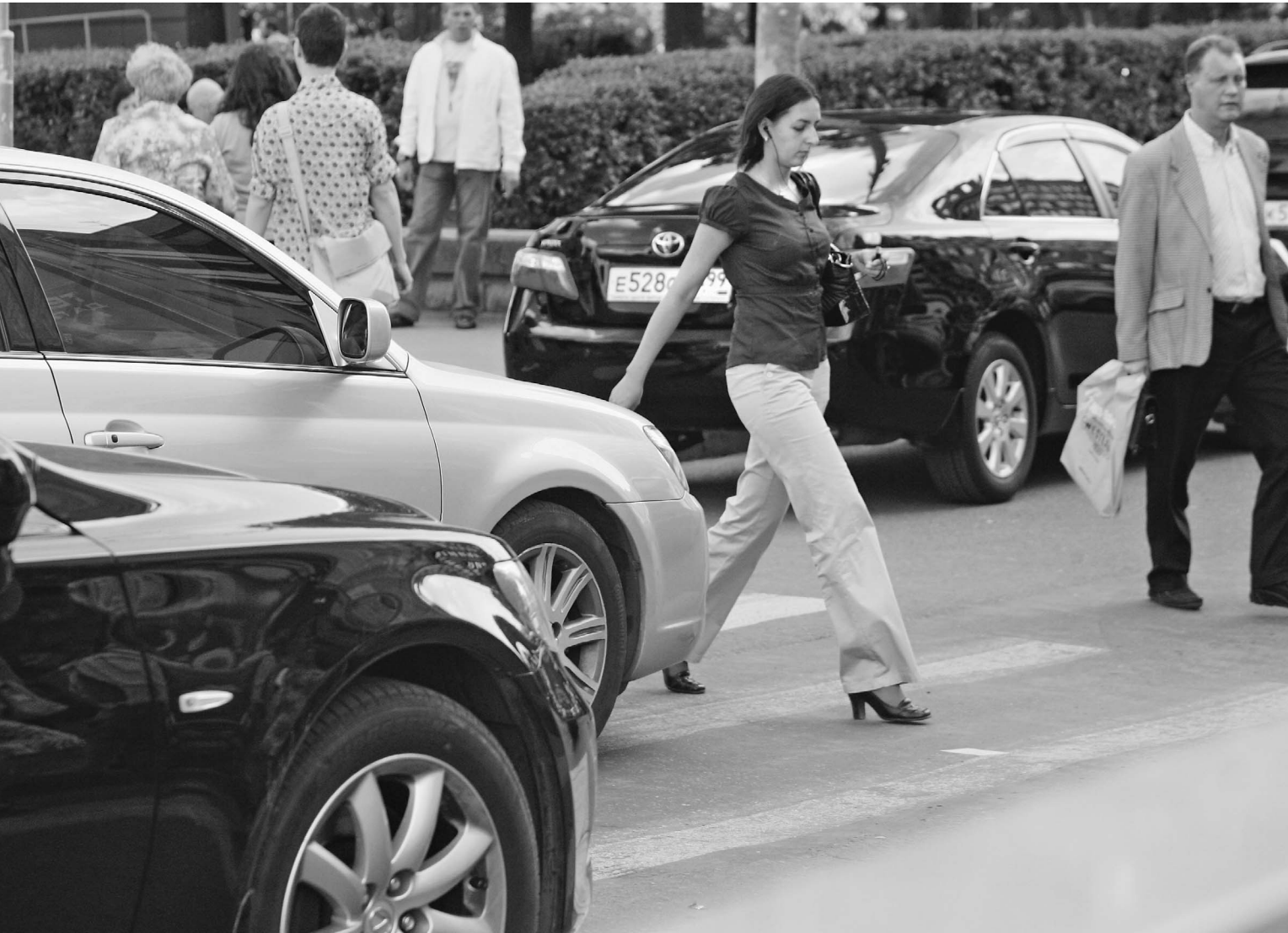
Пешеходный переход по-прежнему опасен для жизни

Десятикратное увеличение «штрафов за зебру» пока не привело к радикальным улучшениям. Люди продолжают гибнуть