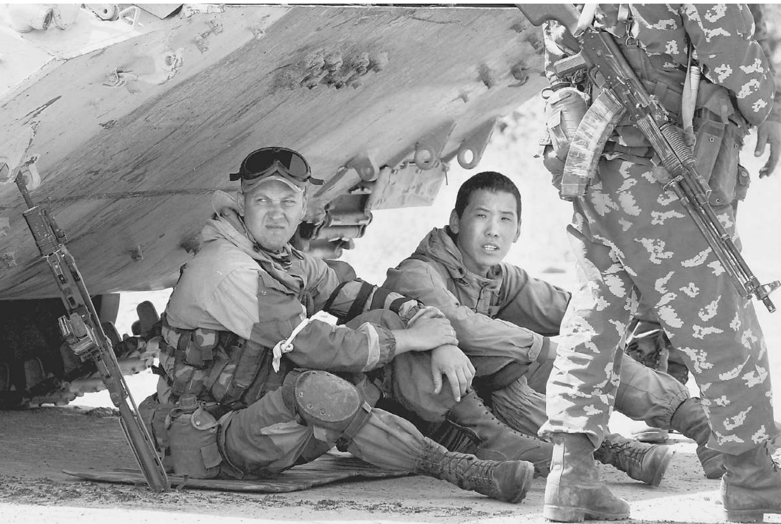
Горнолыжные очки, наколенник, коврик — ныне ПРИВЫЧНЫЕ АКСЕССУАРЫ РОССИЙСКОЙ АРМИИ в зоне грузино-осетинского конфликта

Как водится, когда порох грузино-осетинского конфликта начал рассеиваться, дотошные читатели стали задавать редакции вопросы, о которых как-то не думалось во время недавней войны. Самый частый из них: почему наши солдаты, в отличие от грузинских, выглядят так «разношерстно» — и форма разная, и обувь — кто в ботинках, кто в кроссовках?.. Будто и не армия, а какой-то большой партизанский отряд. «Известия» попытались в «картинке» разобраться и кое-что прояснить. Многое — из личного репортерского опыта, приобретенного на Балканах, в Палестине и Чечне.