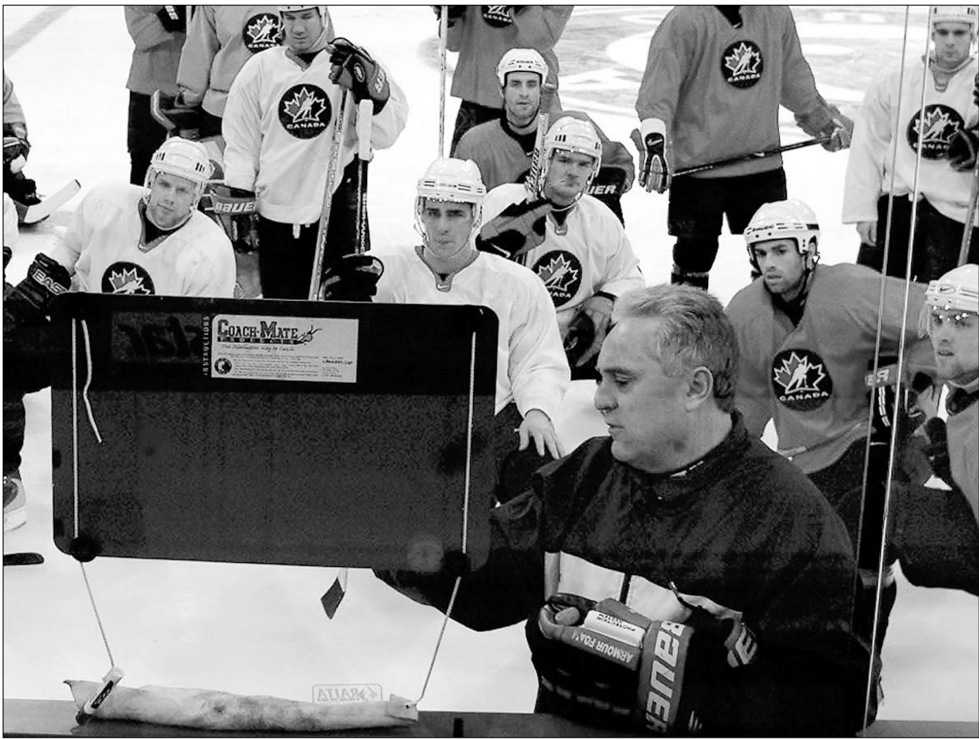
2001 год. Ганновер. Уэйн ФЛЕМИНГ готовит сборную Канады к чемпионату мира.