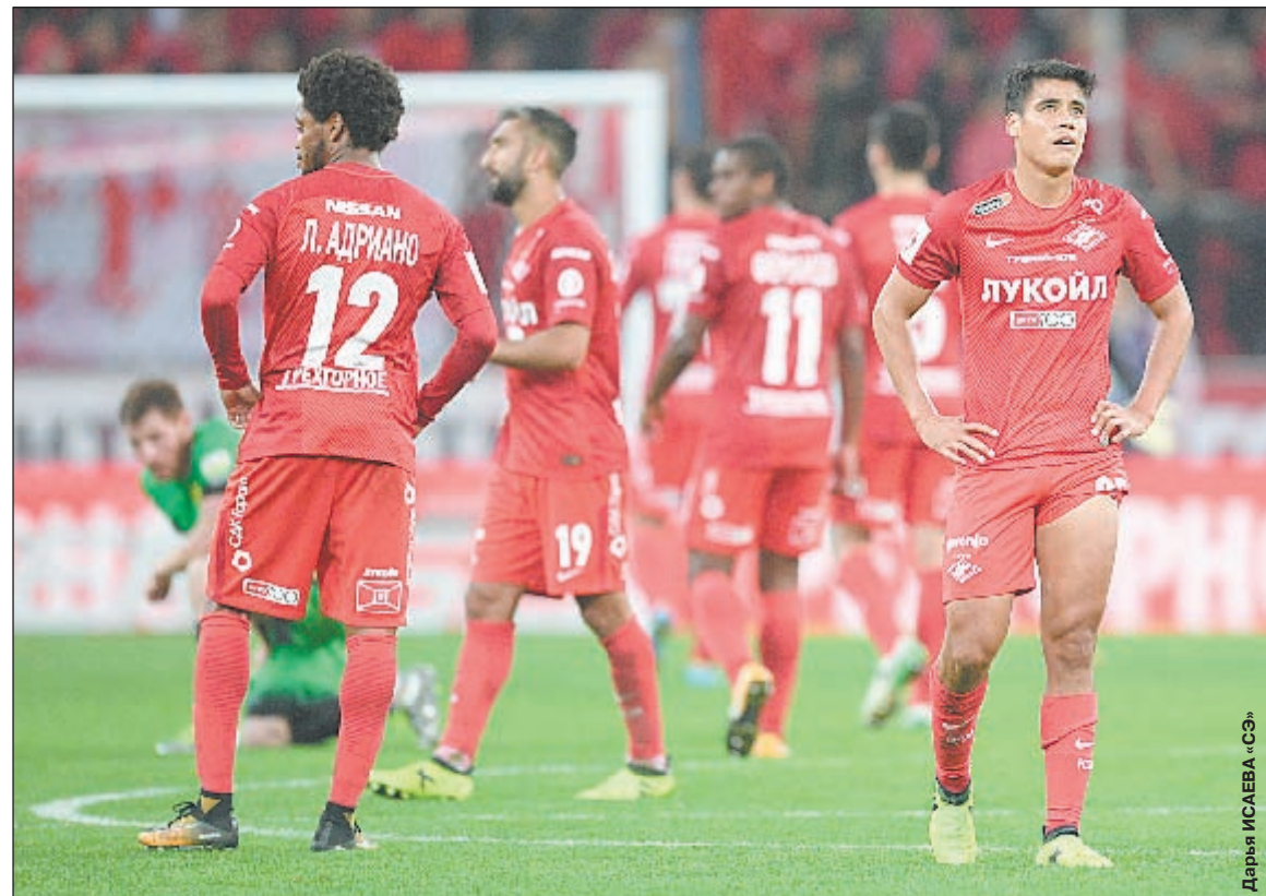
Суббота. Москва. Тушино. «Спартак» - «Анжи» - 2:2. Разочарование красно-белых после матча.