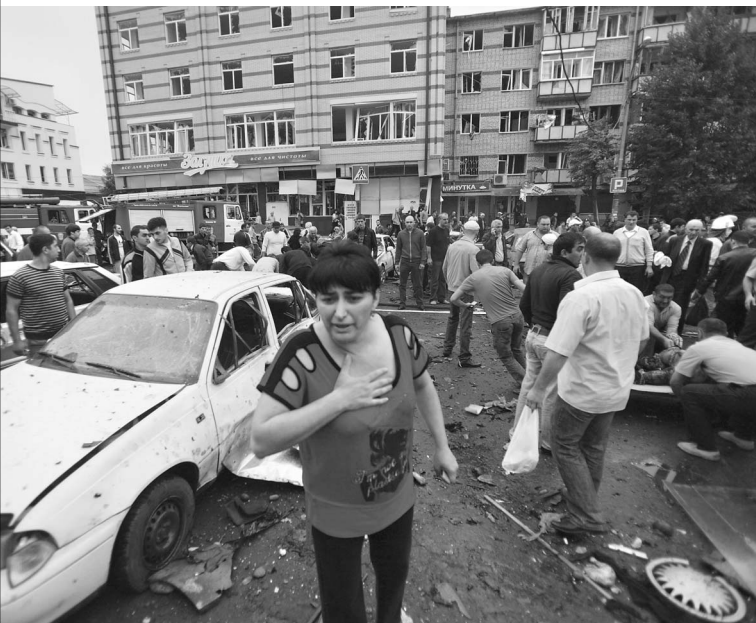
Преступление произошло в священный для мусульман праздник Ураза-байрам