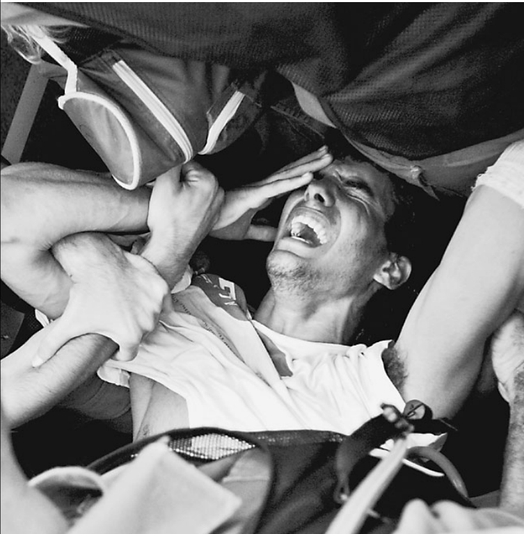
«Сцены принудительного выселения жителей поселений» разрывают сердце Ариэля Шарона

Ночью солдаты вошли в «оплот сопротивления» крупнейшее в секторе Газа поселение Неве-Декалим, где накануне проходили столкновения с полицией. Вчера силы правопорядка окружили местную синагогу, где около двух тысяч поселенцев молились о «спасении души Шарона». Полиция начала переговоры, пытаясь убедить их покинуть сектор. ➔ стр. 4