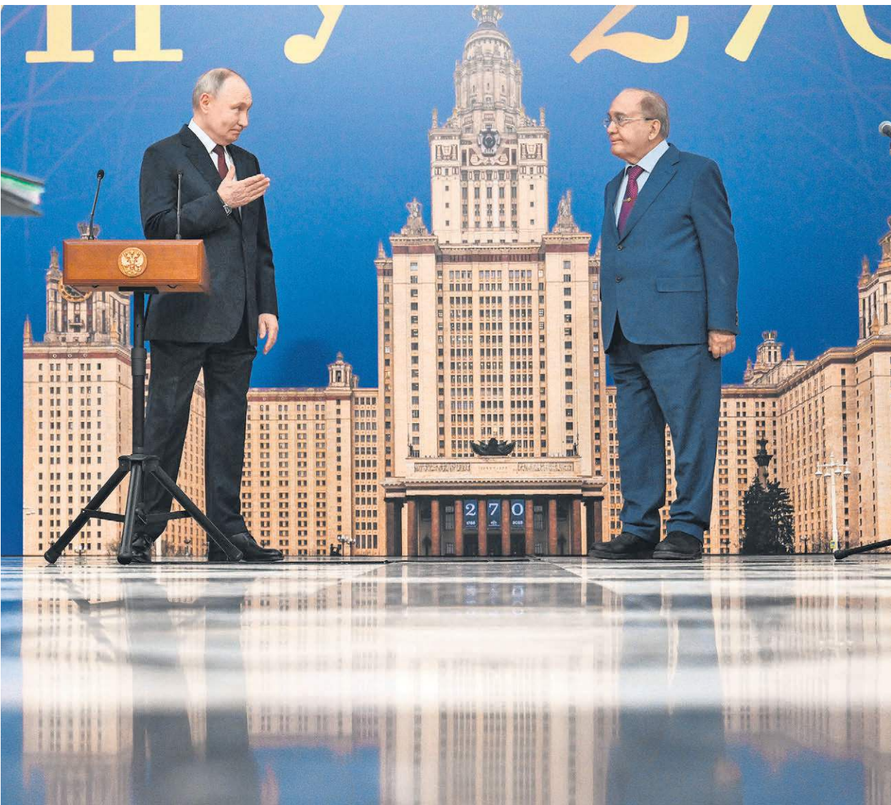
Владимир Путин мало к кому относится так, как к Виктору Садовничему

На каждом кресле лежали таблички с фамилиями участников планируемого торжества, и единственным, кто от-