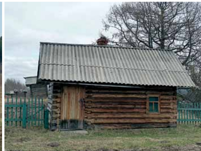
Даже в пасмурный день стены баньки золотом отдают...