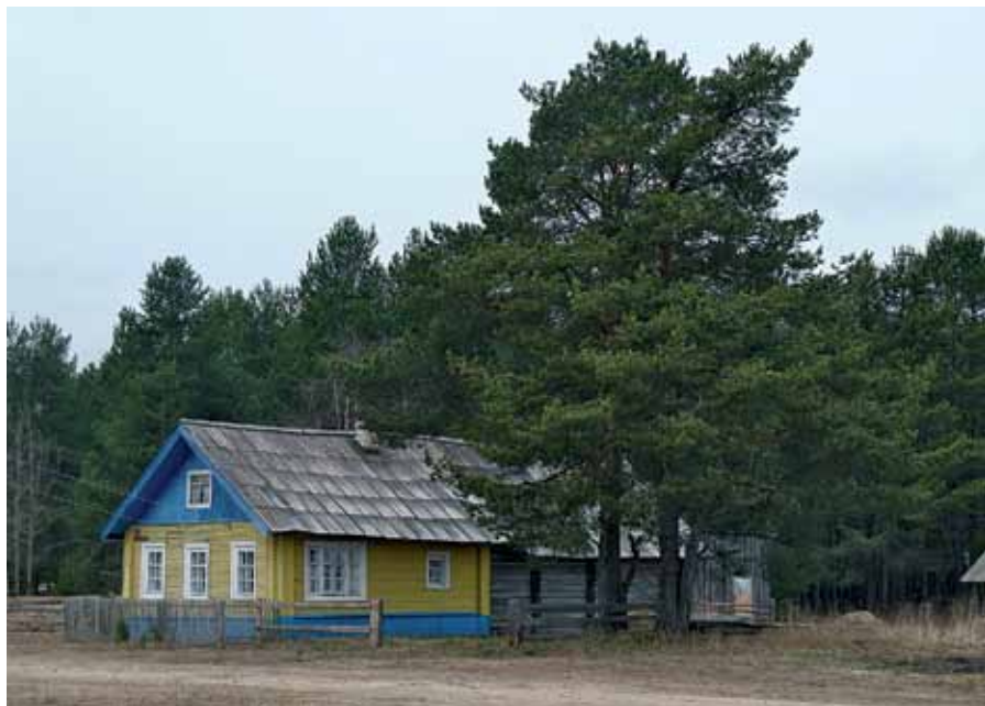
Дом, в котором создавался роман «Братья и сестры»

роман «Братья и сестры» начинается именно с «пекашинской» лиственницы.