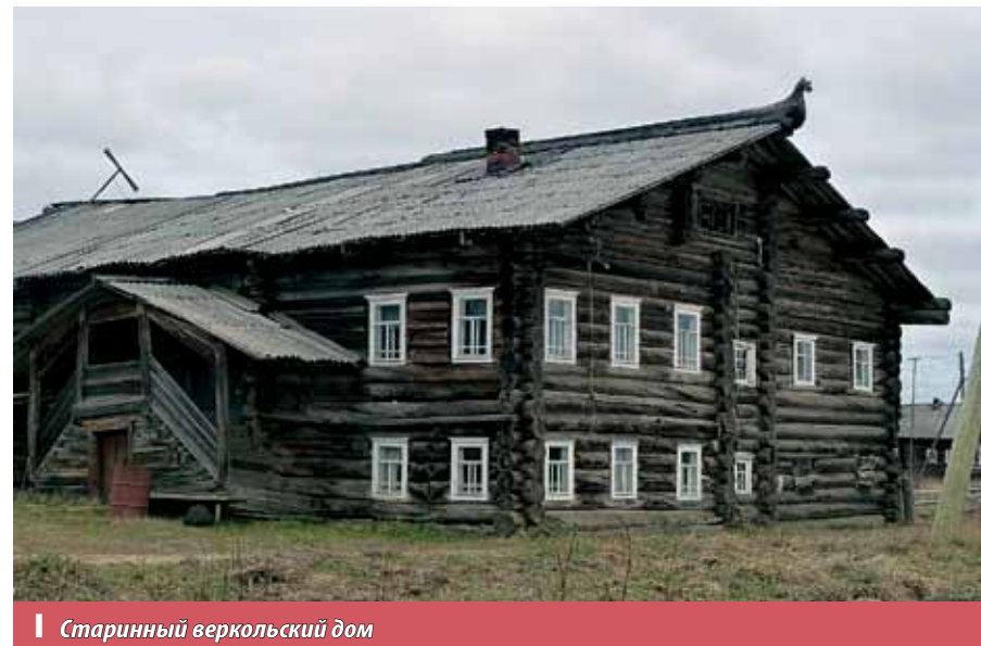
Старинный веркольский дом

Много северных домов видел я, но здесь, в Верколе, они по-особому слажены. Глядишь на такой дом, а он словно на тебя смотрит. Нахлобучился скатом крыши, хоронит взгляд в малых оконцах, горд и суров, как сама северная земля, как студеной река Пинега. А переступишь порог такой избы, то непременно ощутишь добрый уют домашнего очага. Шагнешь через