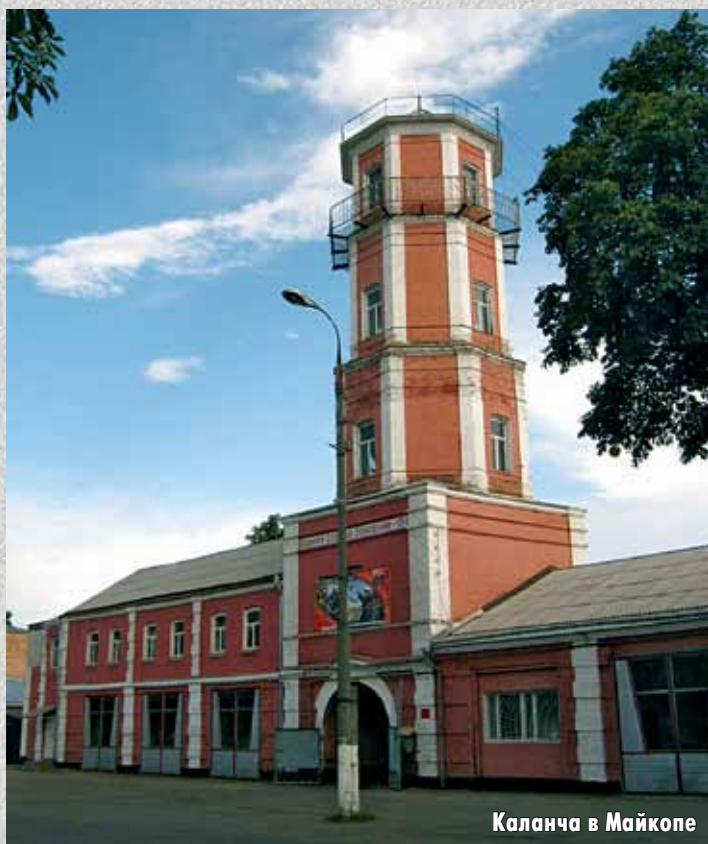
Каланча в Майкопе