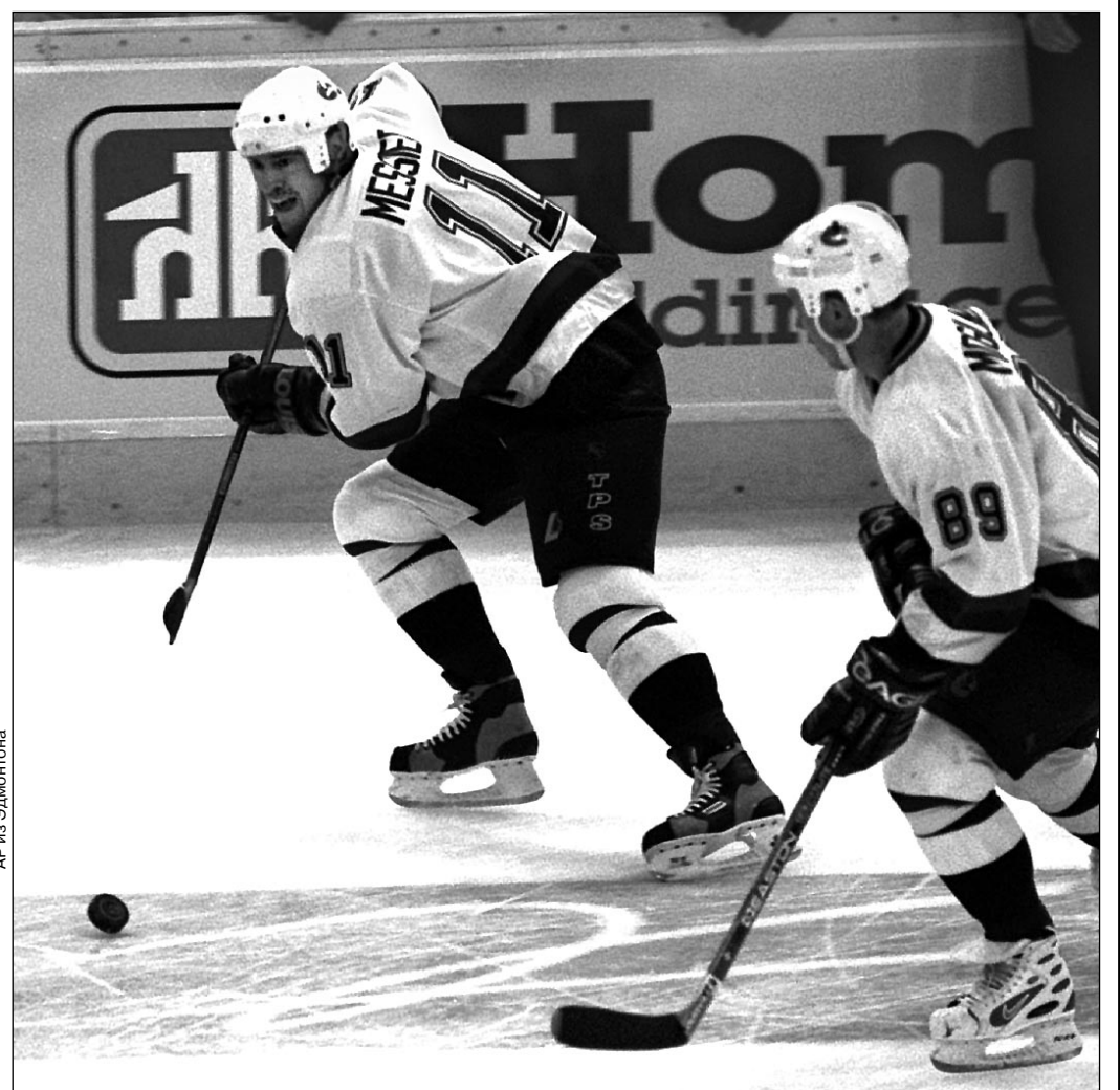
АР из Эдмонта

О матчах, сыгранных в понедельник, - стр. 8