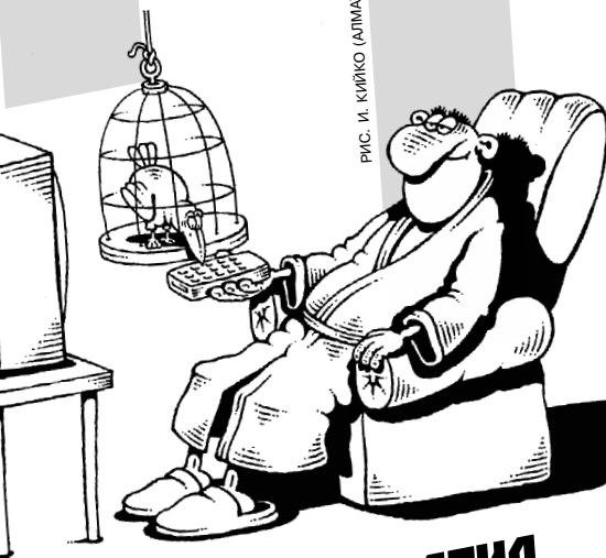
РИС. И. КИРКО (АЛМАТЫ)

АБРАМОВИЧ ПОДАРИЛ ЖЕНЕ ШУБУ размером с яхту!