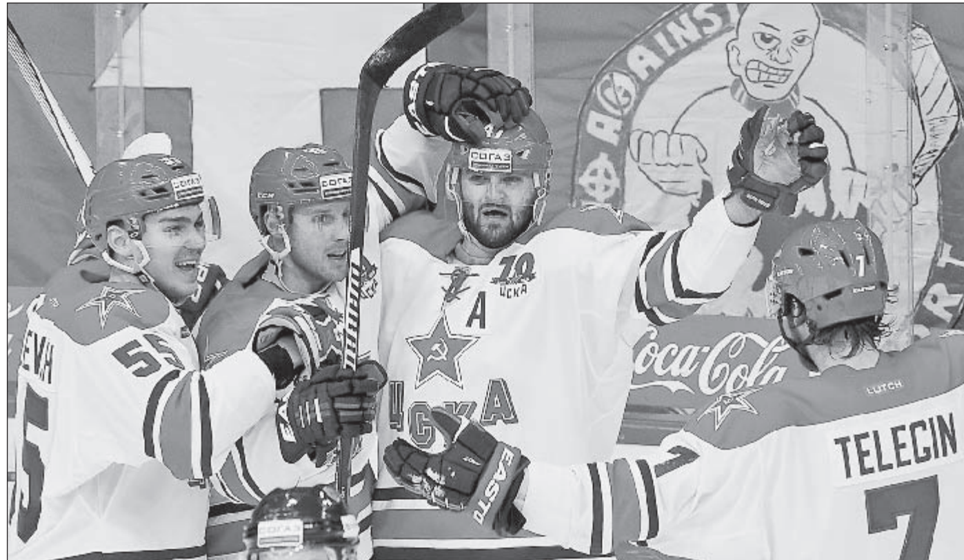
Вчера. Санкт-Петербург. СКА - ЦСКА - 2:3. Московские армейцы празднуют победу.

КХЛ. Регулярный чемпионат. СКА - ЦСКА - 2:3