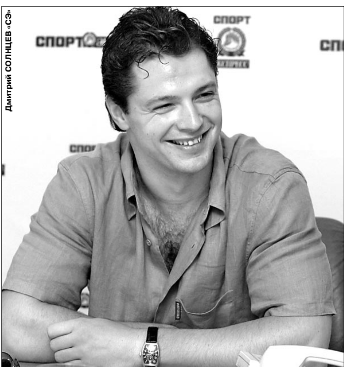
Ответ на эти и другие вопросы - в одном из ближайших номеров

Когда он намерен привезти в Москву Кубок Стэнли? Кого считает лучшим тренером России? Как игроки НХЛ готовятся к локауту? Почему «Нью-Джерси» от него отказался и с каким клубом НХЛ защитник хочет подписать контракт? Как он оценивает уровень российского хоккея и футбола?