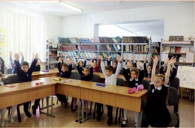
Библиотечные уроки в МОБУ Новобурейской СОШ №3, Амурская область