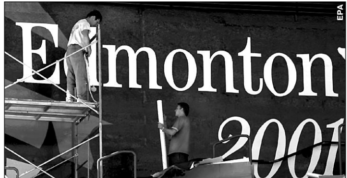
Вчера. Эдмонтон. На Commonwealth Stadium, где пройдут старты чемпионата мира, заканчиваются последние приготовления.

Завтра (в Москве будет уже утро субботы) в канадском Эдмонтоне стартует 8-й чемпионат мира по легкой атлетике. Турнир, который многие обозреватели называют главным спортивным событием года. За 10 дней - с 3 по 12 августа - двум с половиной тысячам атлетов предстоит разыграть 46 комплектов медалей.