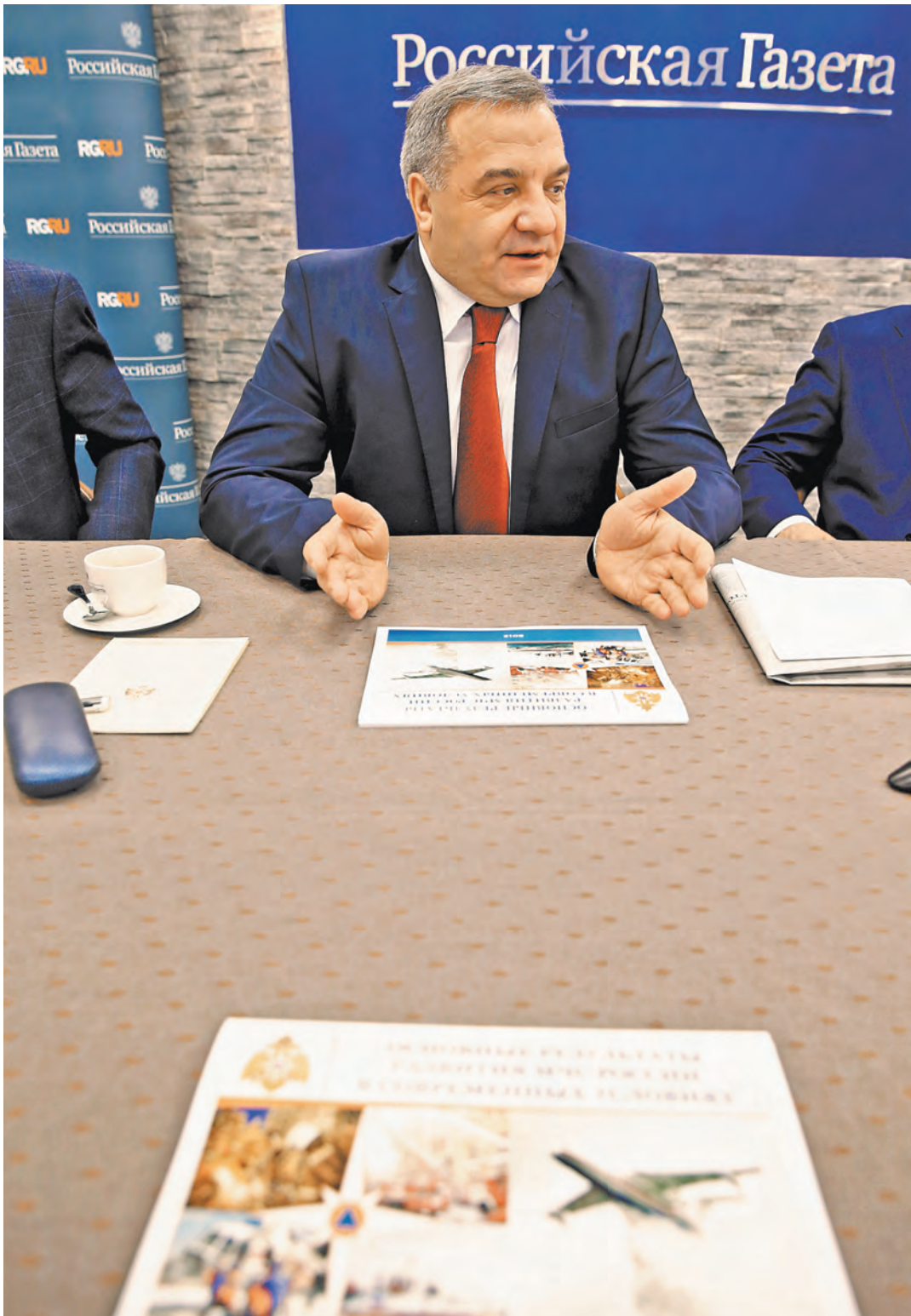
Владимир Пучков: Идти на риск спасателей не учат, это в крови тех, кто выбирает экстремальную профессию.

Пожарно-спасательные подразделения реагируют на все сложные дорожно-транспортные происшествия, когда людям требуется помощь.