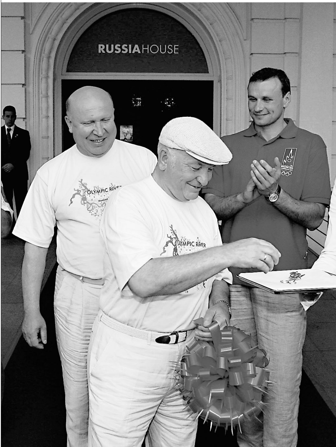
На открытии «Русского дома» Юрий Лужков щеголял в сингапурском варианте своей знаменитой кепки

Томительное ожидание для пятерки городов, претендующих на проведение Олимпиады-2012, закончилось. Сегодня днем в Сингапуре будет назван победитель многомесячной предвыборной гонки, в которой принимали участие крупнейшие мегаполисы планеты — Париж, Лондон, Мадрид, Нью-Йорк и Москва. Судя по тому пафосу, с которым обставлены рекламные кампании городов-претендентов, спорт давно отошел здесь на второй план. Но как бы то ни было, в среду, когда в российской столице будет четыре часа пополудни, президент МОКа Жак Рогге объявит столицу будущих Игр, с представителями которой тут же будет подписан контракт.