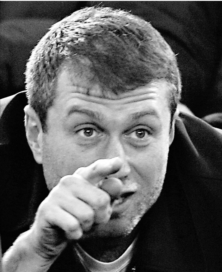
Компания Романа Абрамовича заплатит своим акционерам $2,3 миллиарда

В этом году о рекордных для себя объемах дивидендов помимо «Сибнефти» заявили «Газпром», «ЛУКОЙЛ», РАО «ЕЭС», АвтоВАЗ, «Седьмой континент» и другие. Причем «Седьмой континент» заплатил дивиденды впервые с 2000 года (тогда акционерам досталось по 5 копеек на одну акцию), объем выплат с тех пор увеличился в 20 раз. РАО «ЕЭС» тоже увеличило объем дивидендных выплат — примерно на 18,5%. → стр. 3