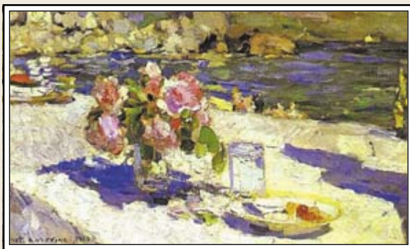
К. Коровин На берегу моря 1910 г.