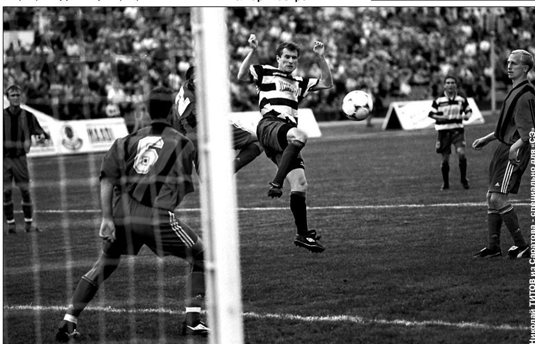
Суббота. Саратов. Стадион «Локомотив». «Сокол» - «Локомотив» 4 - 2:1. Очередная победа саратовцев позволила им продлить свою беспроигрышную серию до 20 матчей.