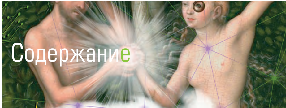
КОЛПАК: КРИЛП РУБЦОВ