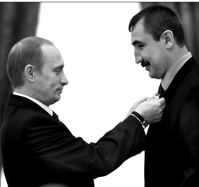
Вчера. Москва. Владимир ПУТИН награждает Александра ЛЕБЗЯКА.